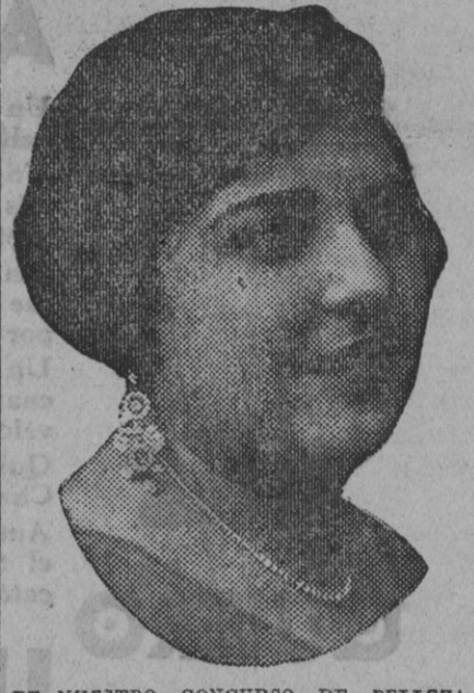
DE NUESTRO CONCURSO DE BELLEZA Número 100.—ISLA CRISTINA. Lema: FLOR ISLEÑA.

Figuran en él: infantería, 18 coronales, 40 tenientes coronales, 77 capitulares, 172 capitanes, 259 tenientes, 128 alféreces y 30 suboficiales, 735 sargentos, 1.050 cabos, 11 cabos de cor-