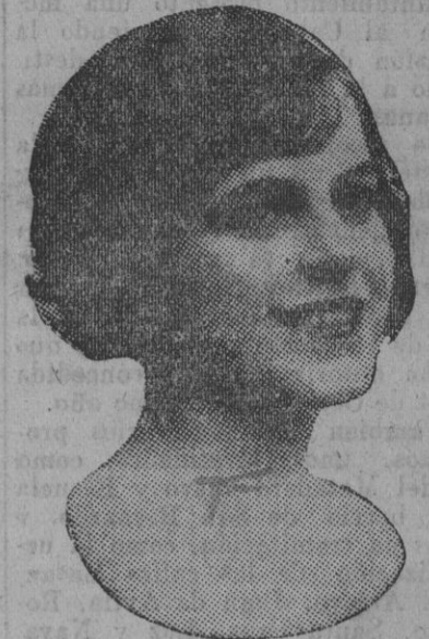
DE NUESTRO CONCURSO DE BELLEZA Número 97.—CADIZ. Lema: ENSUENO.