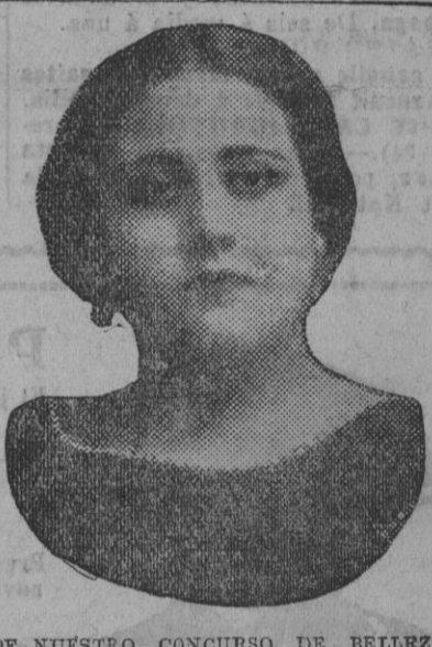
DE NUESTRO CONCURSO DE BELLEZA Número 102.—ALMERIA. Lema: ALMERIA.

El plazo de la inscripción termina el 31 de Marzo y por ello