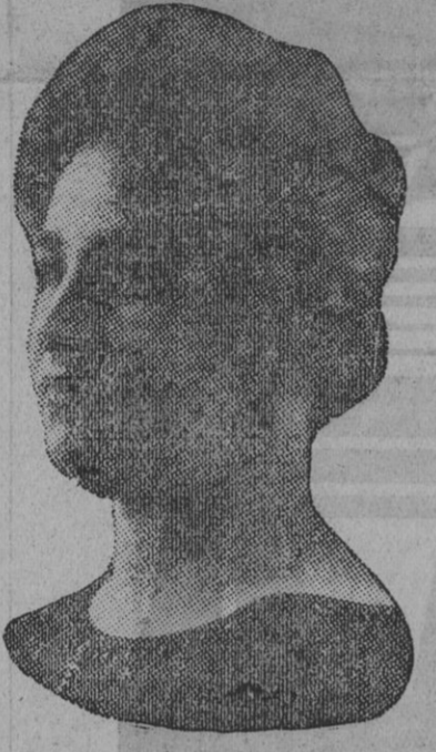
DE NUESTRO CONCURSO DE BELLEZA Número 103.—SEVILLA. Lema: DIOS ES AMOR.

novela de extraordinario interés y enorme emoción, cuyo desarrollo absorbe por completo la atención del lector.