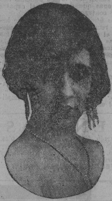
DE NUESTRO CONCURSO DE BELLEZA Número 98.—SEVILLA. Lema: FLOR DE LIS.

mejor reproducción en el periódico, sino también, y muy especialmente, para los efectos posteriores de su exhibición en la "Galería", que diariamente es visitada por infinitas personas, las cuales, a la vista de todos los retratos, hacen su elección para otorgar sus votos a las más bellas.