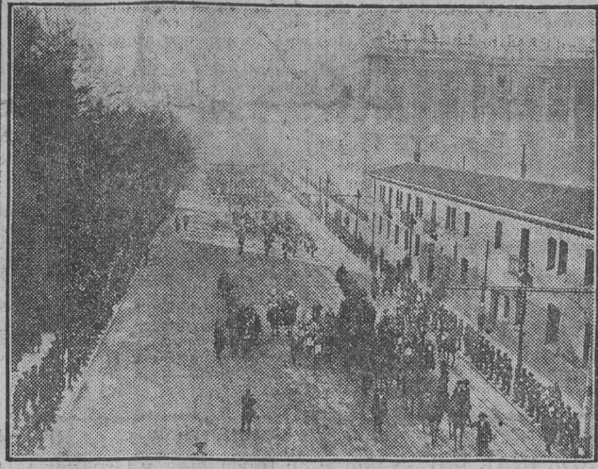
MADRID.—Aspecto de la calle Bailén al paso de la carroza fúnebre conduciendo los restos de la Reina Doña María Cristina.