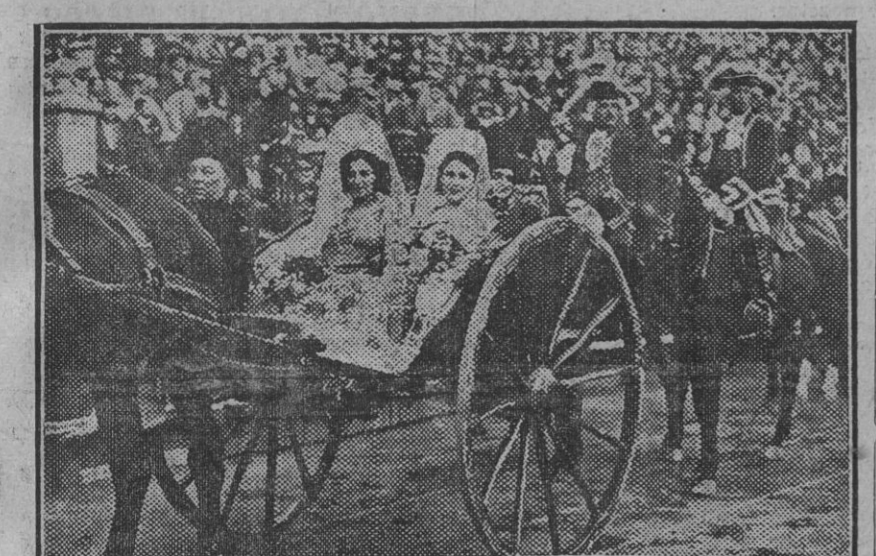
Una de las calesas que figuraron en el desfile «goyesco» de la corrida de ayer tarde.

Madrid 22.—El Maharajah de Patiala, acompañado de su séquito, estuvo visitando á la infanta doña Isabel y al infante don Fernando. Terminadas estas visitas marchó á El Escorial, con sus ayudantes, visitando el Monasterio y regresando después á Palacio. A las diez de la noche se celebró en el regio Alcázar el banquete de gala ofrecido al Maharajah por los Reyes.