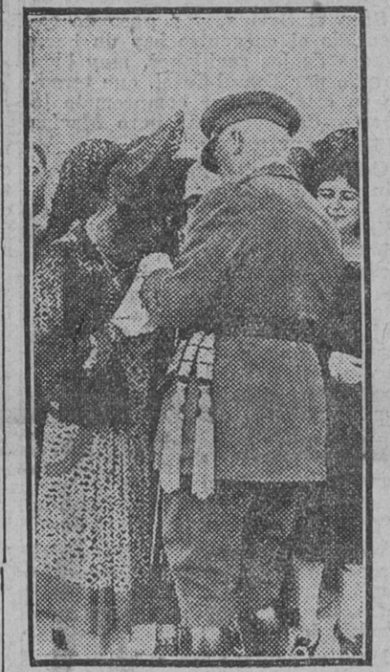
S. A. R. el Infante Don Carlos imponiendo la Medalla de Oro del Somatén a su augusta hija la infanta Doña Isabel Alfonso, madrina del Somatén de Sevilla.

A las once de la mañana de ayer, como anunciamos en nuestras ediciones últimas, tuvo lugar el solemne acto de imponer la medalla del Somatén a la infanta Doña Isabel Alfonso, madrina de la bandera del Somatén de Sevilla, y a las ilustres damas madrinas también de las banderas de los Somatenes de la región. Celebróse la ceremonia no en la terraza del palacio de Arte de Antiguo.