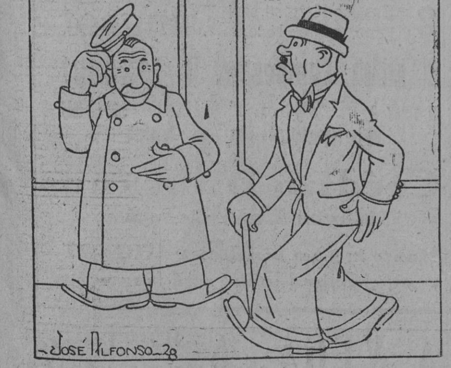
-Ya estará el salón lleno de idiotas, ¿verdad? -No, señor; usted es el primero que llega.

Terminadas las obras de calefacción y nuevas instalaciones en la Clínica Victoria Eugenia de la Cruz Roja, a partir del primero de Octubre serán admitidos enfermos en la misma, dando comienzo las consultas del dispensario con arreglo a las horas que el cuadro de distribución de servicios indica.