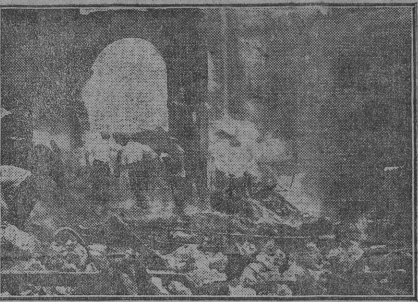
Los bomberos, soldados de Ingenieros y obreros de los servicios municipales buscando entre los escombros los cadáveres de los espectadores que perecieron en el interior del teatro, cuando intentaban ganar la salida del mismo.