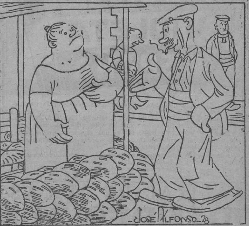
—Hace un rato le dió usted a un amigo mio un melón por tres chicas. —Es que estaba echado a perder. —Bueno, pues écheme usted a per der cuatro ó cinco melones.