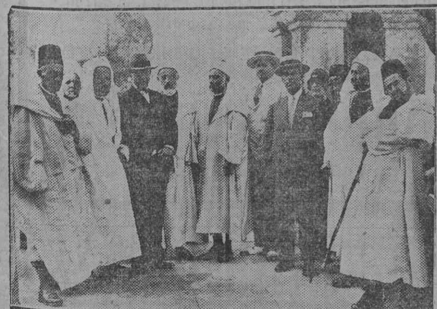
Los moros notables en el campamento de la Giralda, cuya visita hicieron esta mañana. (Fdo. Gori.)

Después de curado pasó a su domicilio, pues se negó a ser hospitalizado.