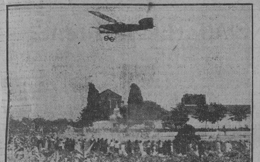
Vista del Santuario de Loreto, donde se han celebrado las fiestas en honor de la Patrona de la Aviación, en el momento de salir procesionalmente la mila grosa imagen.