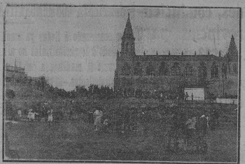
CHIPIONA.—Regreso de la procesión al Santuario de Regia.