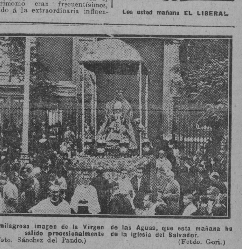
La milagrosa imagen de la Virgen de las Aguas, que esta mañana ha salido procesionalmente de la iglesia del Salvador.