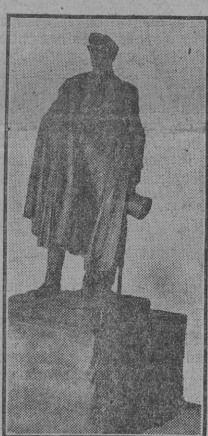
CORDOBA.— Magnífica estatua en bronce del duque de Rivas, obra del señor Benlliure, que se colocará en el proyectado monumento de los Jardines de la Victoria, expuesta en uno de los salones del Ayuntamiento para que pueda ser visitada por el pueblo cordobés.

En una serie de conferencias científicas que han llamado altamente la atención de todas las personas interesadas en esta clase de problemas, el eminente geógrafo berlinés profesor Albrecht Penck ha demostrado con datos y argumentos de una solidez irrefutable que el pretendido exceso de población de que, según algunos, se encuentra en breve plazo amenazado nuestro planeta, no pasa de ser una fábula completamente desprovista de fundamento.