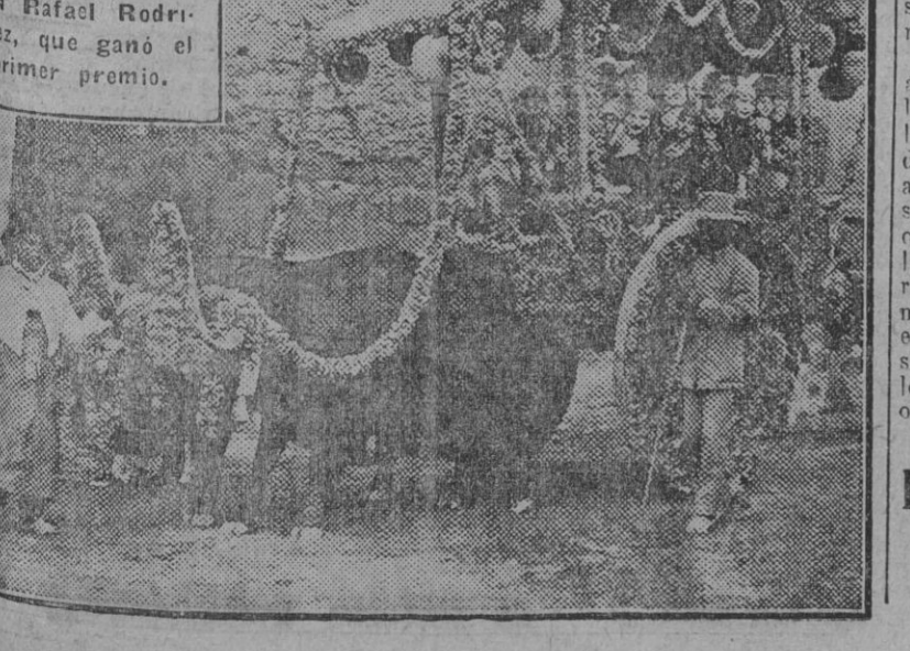
La milagrosa imagen de la Virgen de las Aguas, que esta mañana ha salido procesionalmente de la iglesia del Salvador. (Fdo. Gori.)