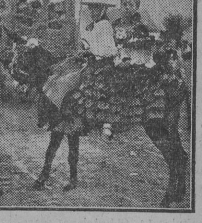
CARMONA.—Pequeña pareja en burro que mereció los calurosos elogios de todos y principalmente de la Comisión.