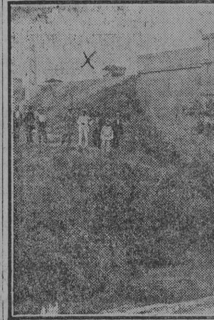
La cruz de arriba indica el sitio por el que se despenó el coche, que vino a caer en el lecho del arroyo, que marca la cruz de abajo, donde hay más de un metro de agua