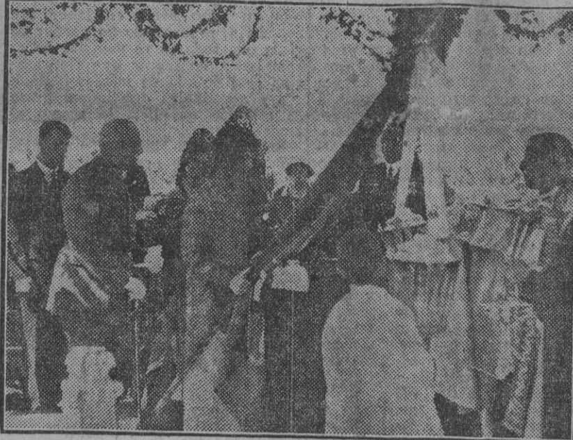
SANLUCAR DE BARRAMEDA.—Momento solemne de ser bendecida la bandera del Somatén, amadrinada por la princesa Beatriz de Sajonia...