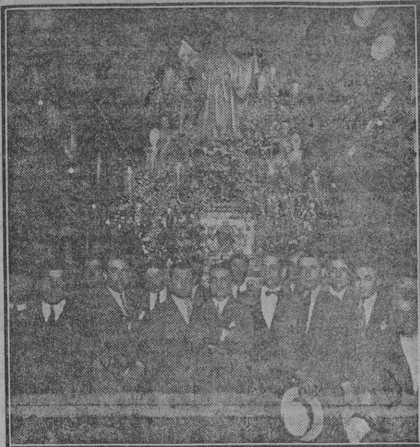
Procesión de la venerada imagen de Nuestra Señora de la Asunción, patrona de Cantillana (Fdo. Gori.)

NUESTROS SUSCRIPTORES DE SEVILLA QUE SE AUSENTEN DE LA CAPITAL DURANTE LOS MESES DE VERANO RECIBIRAN «EL LIBERAL», SIN AUMENTO DE PRECIO, EN EL SITIO DONDE SE TRASLADEN