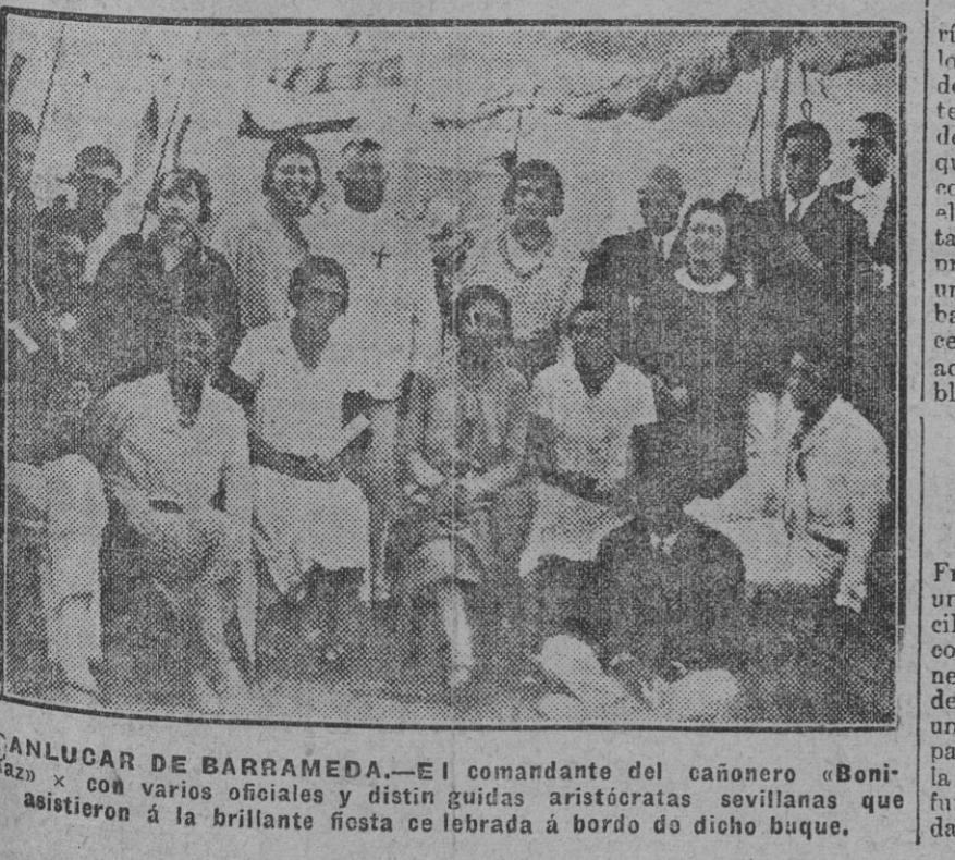
DANLUJAR DE BARRAMEDA.—El comandante del cañonero «Bonifacio» con varios oficiales y distinguidas aristócratas sevillanas que asistieron á la brillante fiesta celebrada á bordo de dicho buque.