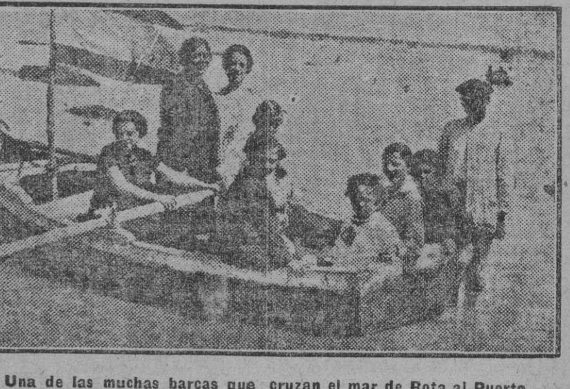
Una de las muchas barcas que cruzan el mar de Rota al Puerto.

El respeto á los animales, el cariño á ellos, acaso más que cosa de educación es algo innato en quien lo siente. Yo conozco chicos que belicosos en lucha constante con todo lo que es muchachos que, de dejarlos, acabarían con todo cuanto en el orbe tiene cosas de vida siquiera; muchachos que se complacen en exterminar en deshacer en convertir en polvillo impalpable una flor, un pájaro. Otros, muy al contrario, se contentan con oler cuidadosamente esa flor, con acariciar con mimo como ese pájaro. Una gran familia de esta última rama, ha sentido sus reales en Sevilla. Indudablemente. La entrada por primera vez al Parque de María Luisa tiene esta simpática visión: una intimidad, una fraternidad dulce entre las flores y los pájaros y los niños. En un paseo correaan los chiquillos entre las palomas, entre los gorriones que, golosos, les rodean siempre. Y no se espantan. Dan un corto vuelo, dan unos saltitos y se quitan del camino que los chiquillos llevan en su jugueteo inquieto. Nada más. Y en sus vuelos cortos, en sus saltitos, hay como un ansia irrefrenable de jugar también. Yo diría que los pájaros y las palomas rolean á los niños más por ansia de juego que esperando