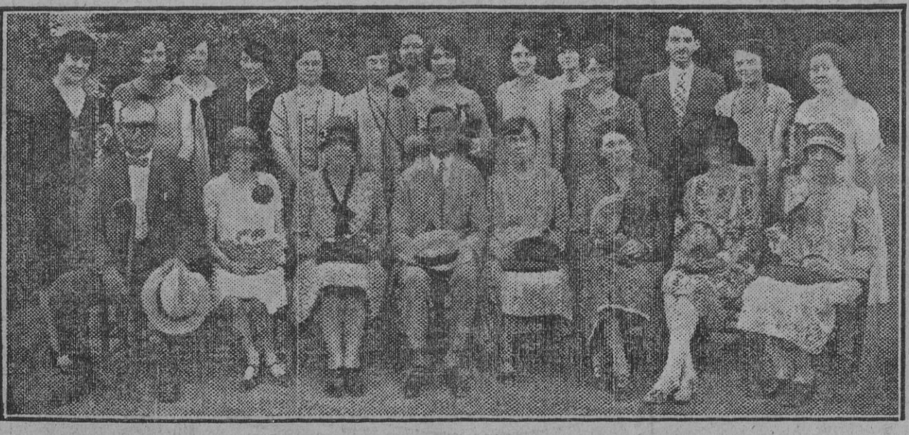
Las alumnas del Instituto de las Españas en New York que se encuentran en Sevilla en viaje de estudio.