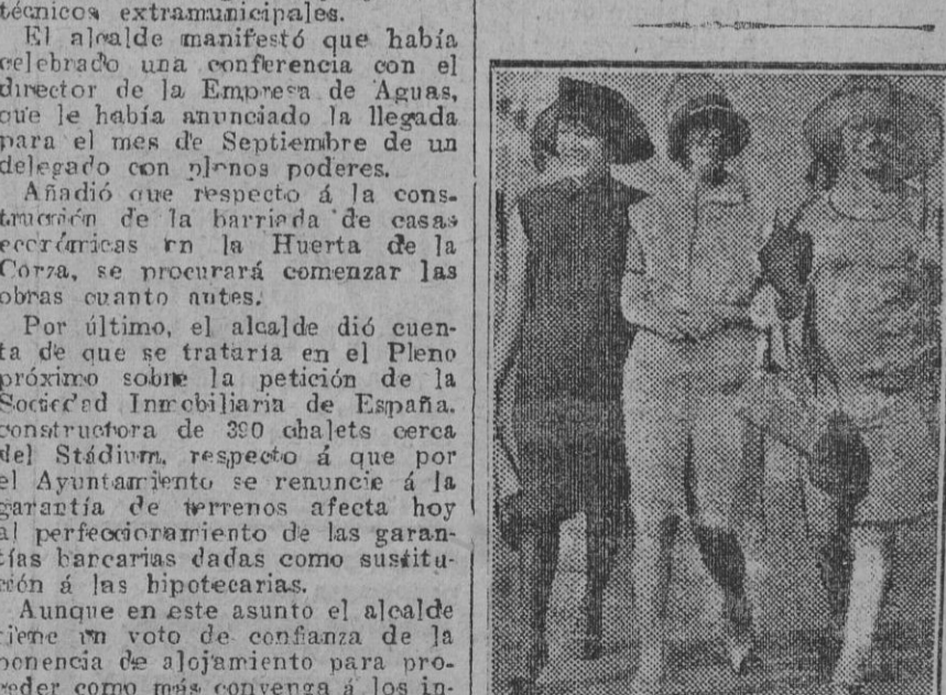
En las playas del Sur abundan las bañistas guapas. Ved la muestra.

Lo que piden los veraneantes sevillanos, es que el envío se haga por el Puerto de Santa María, en el expreso de la mañana, ya que la Compañía de los ferrocarriles andaluces tiene montado un servicio de enlace con el citado expreso, y tanto en Rota como en Chipiona, la correspondencia y los paquetes del Prensa se recibían a la una de la tarde, ordenando previamente a los carteros de ambas localidades su reparto inmediato. De esta forma, las horas de forzosa incomunicación, actualmente, se remediarían y los veraneantes, en su mayoría personas de negocios e intereses en Sevilla, podrían atenderlos bastante mejor desde sus residencias veraniegas, sin perjuicio de ninguna clase para la Administración de Correos. Confiamos en que por el administrador de la Principal de Sevilla esta petición se atenderá, remediando el gran retraso que actualmente sufren correspondencia y periódicos, si se tiene en cuenta la distancia de nuestra capital con los puertos citados.