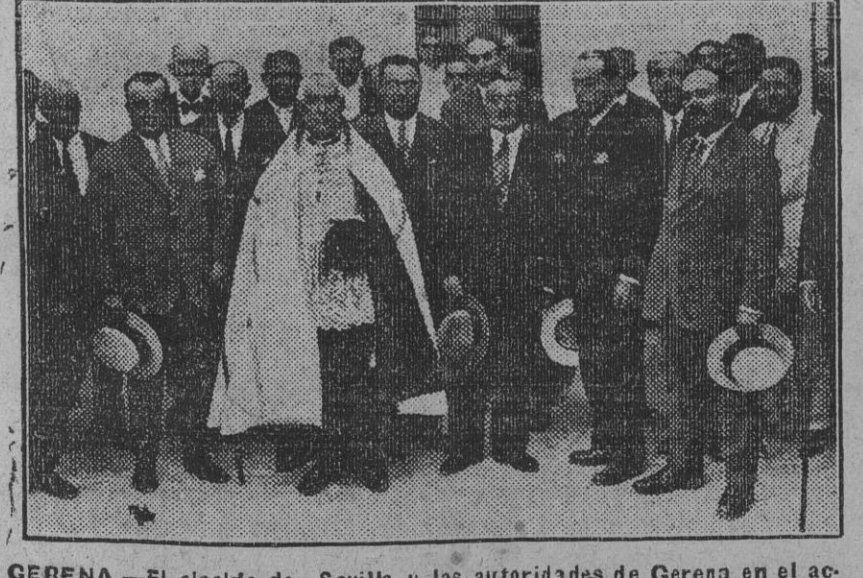
GERAENA.—El alcalde de Sevilla y las autoridades de Geraena en el acto de la inauguración del grupo escolar. Acto que tuvo lugar ayer y cuya información publicaremos en la edición próxima.