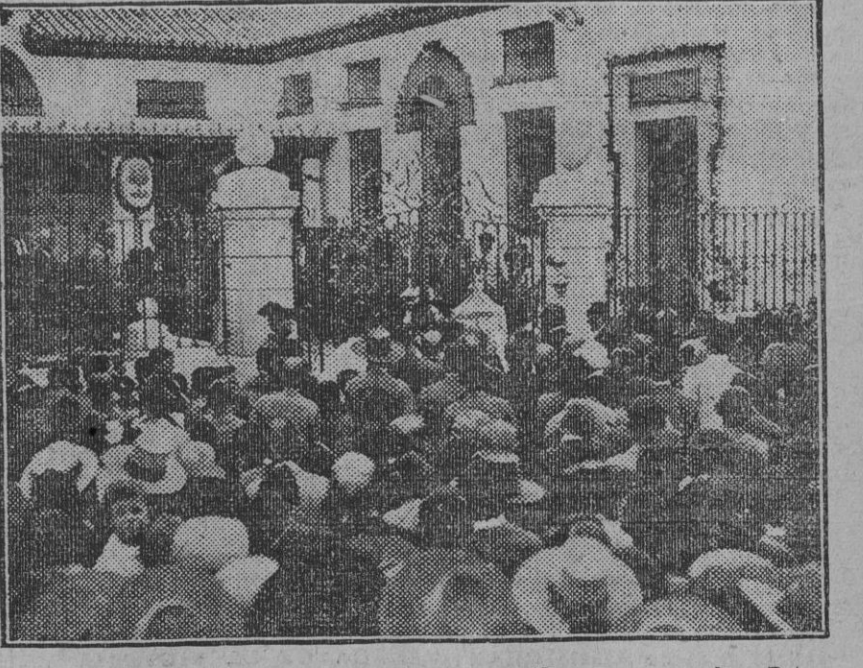
GERENA.—Momento de inaugurar el magnífico grupo escolar Primo de Rivera.