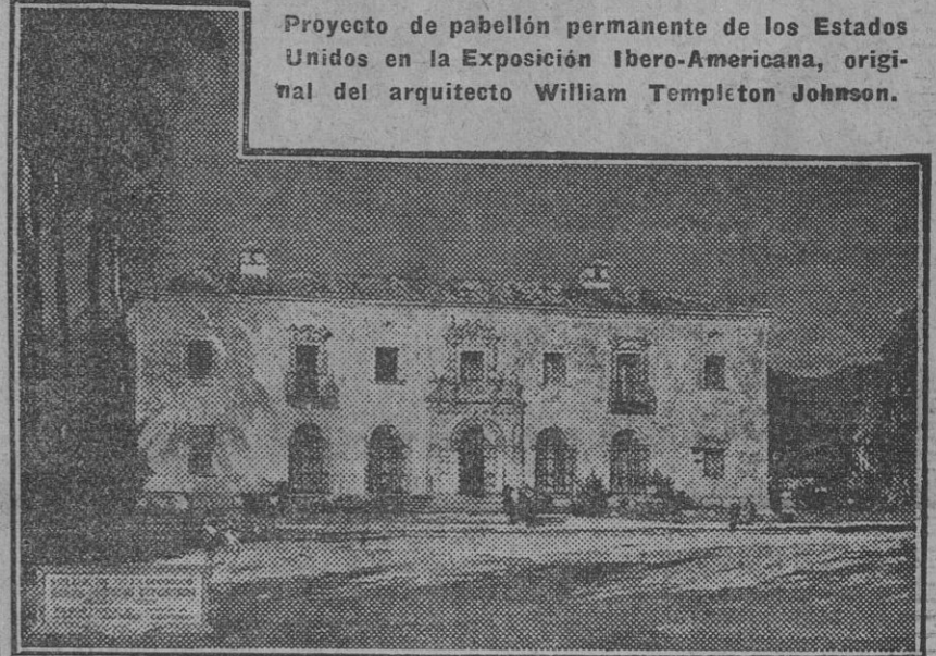
Proyecto de pabellón permanente de los Estados Unidos en la Exposición Ibero-Americana, original del arquitecto William Templeton Johnson.

El costo de los edificios se calcula en 300.000 dólares, y se cree que estarán terminados hacia el 10 de Octubre de 1928.