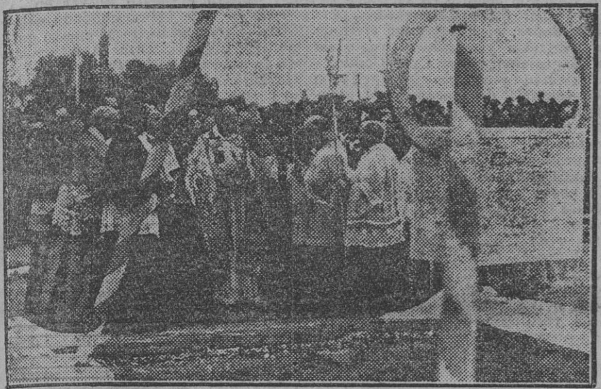
Después de la ceremonia de la bendición, el Cardenal entona las oraciones rituales.