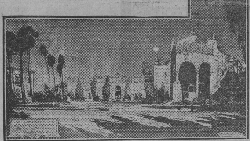
Pabellones provisionales norteamericanos de cinematografía—la derecha—y de exposición de material eléctrico.

El cardenal y la representación del Cabildo salieron al encuentro de Jorge II y seguidamente le acompañaron a visitar las capillas de más alto valor artístico, el retablo del altar mayor, el coro y cuanto de más notable guarda la Catedral.