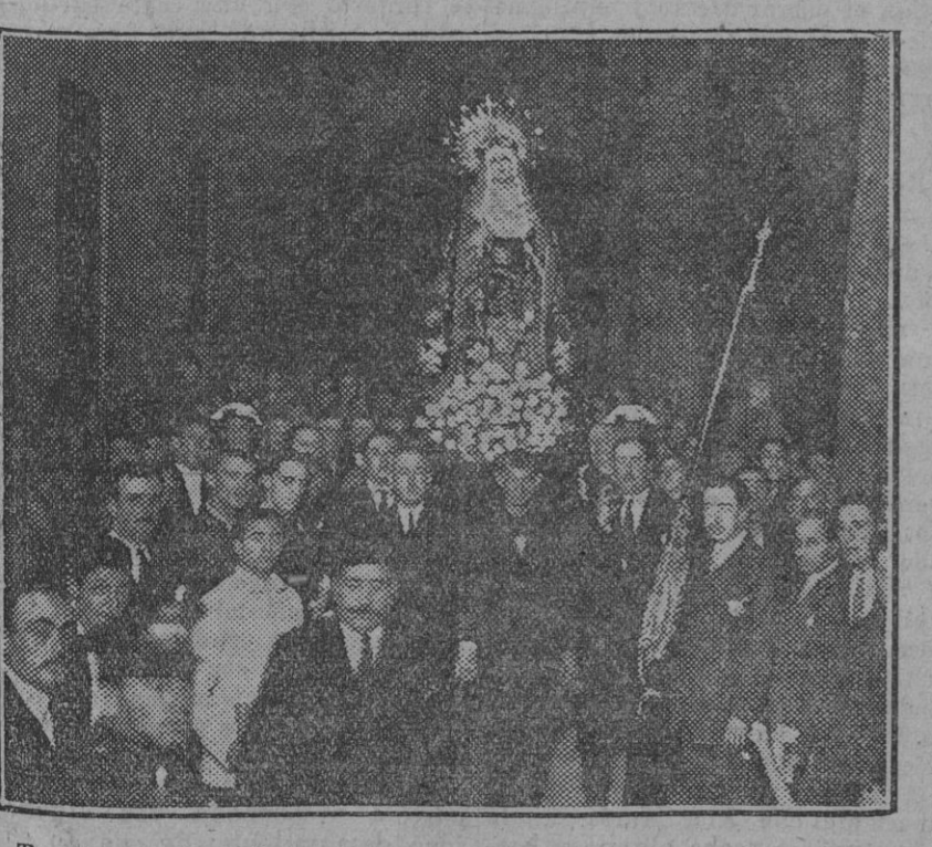
Traslado de la bella y milagrosa imagen de la Virgen de la Soledad, de la capilla de la Carretera, donde actualmente se verifican obras de reformas, a la iglesia de la Caridad, donde se celebra un solemne septenario, que comenzó anoche con gran concurrencia de fieles.