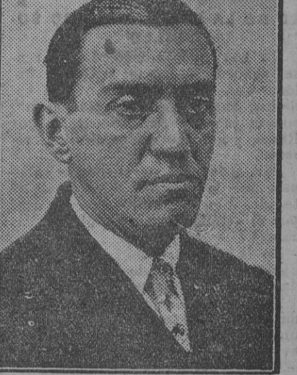
El ilustre novelista don Ramón Pérez de Ayala, cuya candidatura para académico de la lengua está siendo tan discutida.