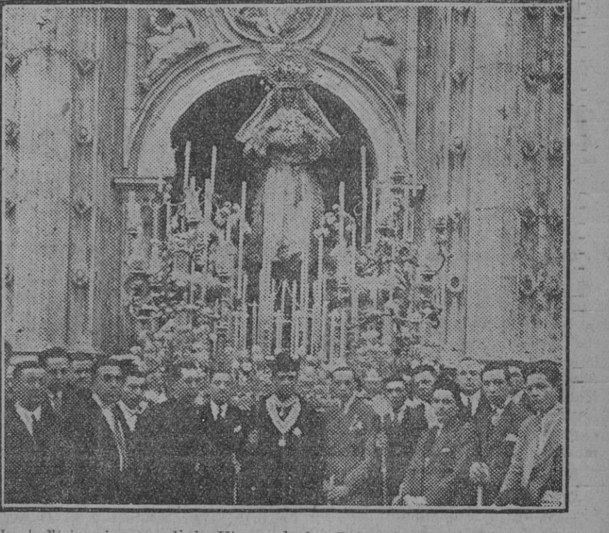
La bellísima imagen de la Virgen de los Desamparados, que desde la capilla del Hospital Central ha sido llevada a su iglesia de San Esteban, una vez restaurado el templo y ser nuevamente bendecido para el culto. La procesión resultó solemnísimas, figurando en la misma varios centenares de fieles.