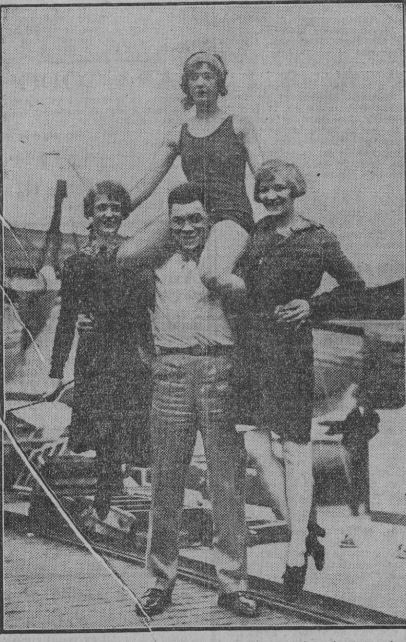
NUEVA YORK. — El campeón vasco Paulino Uzeudum demostrando la fuerza de sus músculos a tres graciosas «girls» norteamericanas.

Duffield, indultado de la pena capital, sufrirá cadena perpetua. «Porque el Señor no desechará para siempre: antes, si afligiere, también se compadecerá según la multitud de sus misericordias.» (S. M., ep. 3, vers. 31 y 32.)