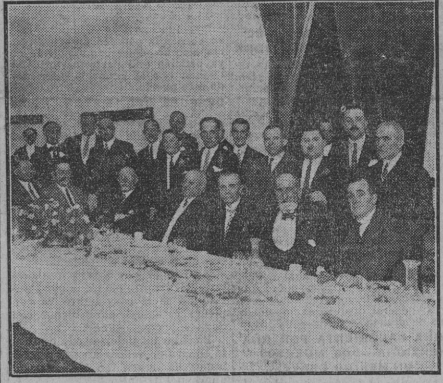
Presidencia del banquete con que la colonia francesa festejó la histórica fecha del 14 de Julio.

III como haríamos si la mala acción fuese cometida por alguno de nuestros familiares o amigos queridos. La fraternidad universal, al envolver la máxima que queremos para nosotros lo que no queremos para nuestros hijos, clara y terminantemente nos dice que no tenemos derecho a descubrir las flaquezas, debilidades, faltas y vicios de nadie.