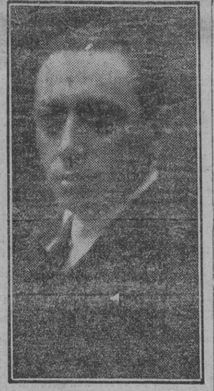
DR. D. ESTANISLAO DEL CAMPO

Hemos llegado á unos tristes tiempos para la democracia. Cuántos traductores exigidos, cuántos mixtificados falaces suscitados furibundos para la suicida obra de desconocerla y menospreciarla!