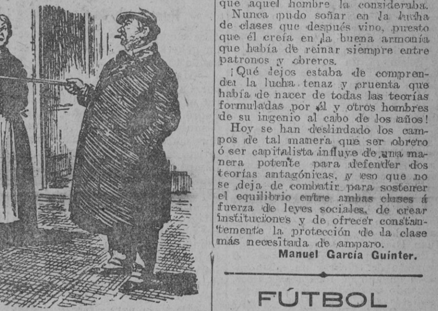
El actor, examinando la habitación que pretende arrendar.—La ventana es demasiado pequeña; yo no podría salir por ella en un caso de apuro. La encargada.—Eso no tiene que preocupar; aquí se cobra por adelantado.