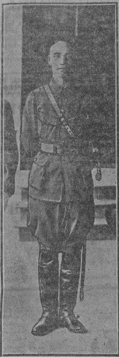
El general Chang-Kai-Shek, comandante en jefe del Ejército chino, que ha atacado a los barcos de la escuadra inglesa.

SEVILLA Suscripciones: MADRID: Un mes... 2 pts. PROVINCIA: Trimestre... 6 EXTRANJERO: Trimestre... 15 Número suelto, 10 cts.