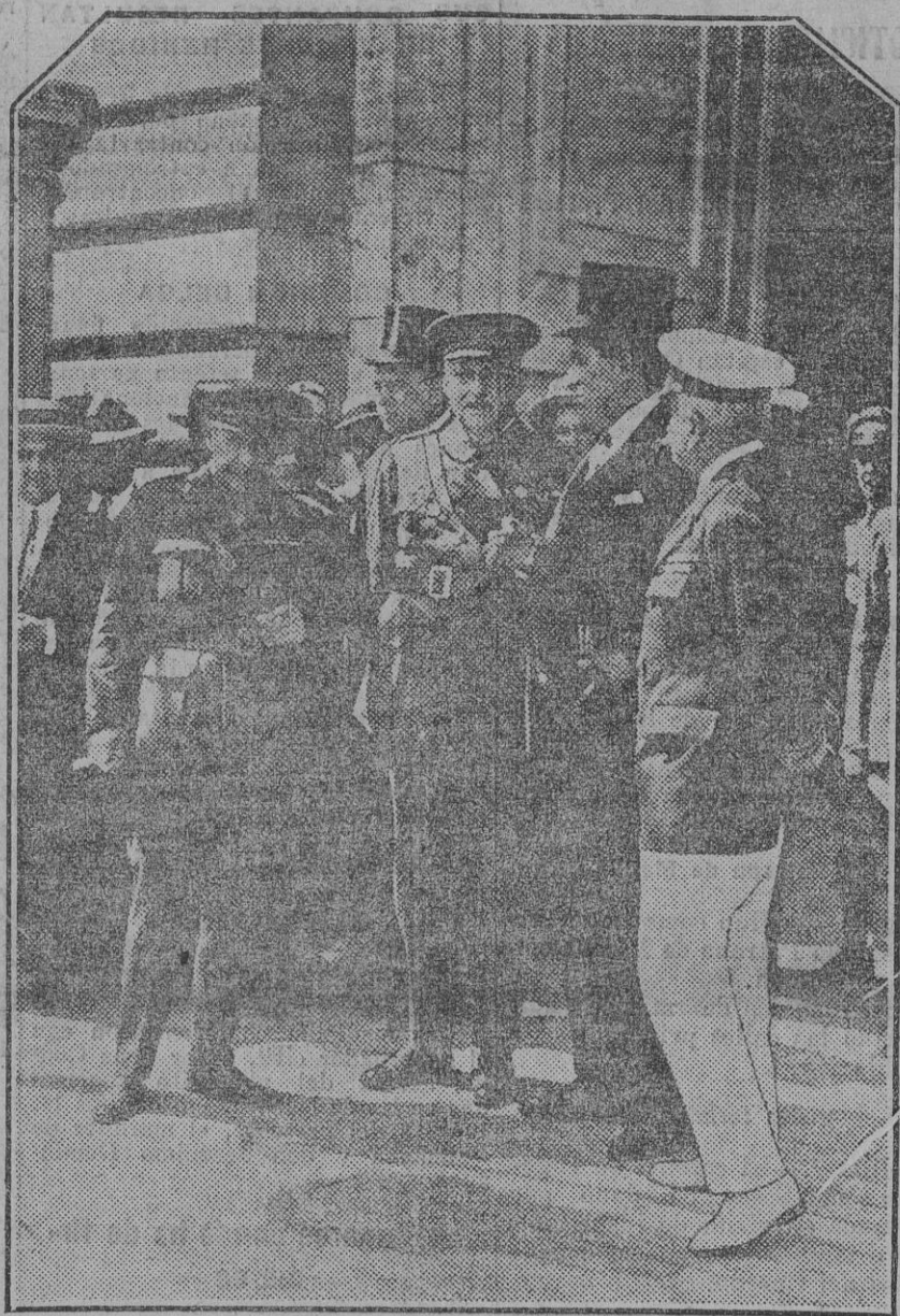
MADRID.—El general Primo de Rivera, con los ministros, saliendo del Palacio, después del Consejo celebrado con el Rey.