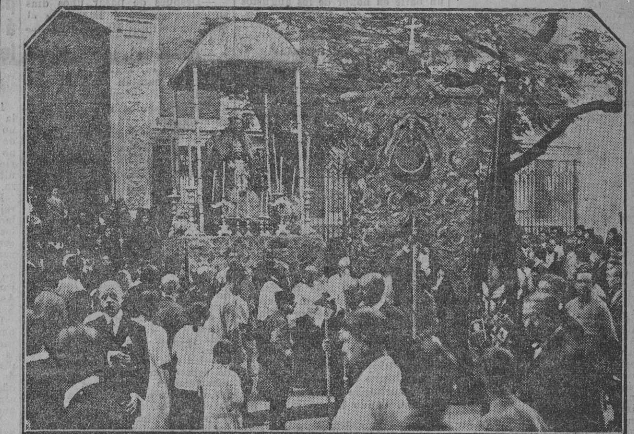
Nuestra Señora de las Aguas, que esta mañana salió procesionalmente de la iglesia del Divino Salvador. (Fdo. Gori.)

Expedientes Bases del concurso de proyectos para un nuevo Mercado de Abastos en solares del antiguo Matadero.