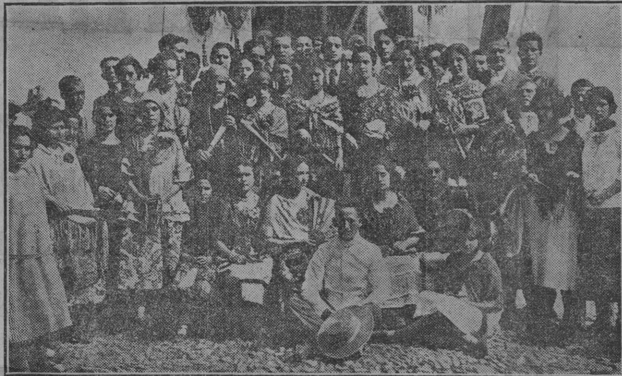
El de la Hermandad de Fuenterrebidas, premiado en el concurso.