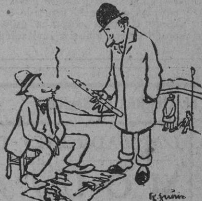
—Diez pesetas por esta flauta... con los agujeros que tiene?