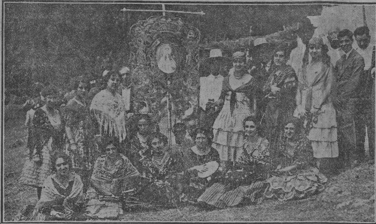
El de la Hermandad de Nuestra Señora del Prado, de Higuera de la Sierra, premiado en el concurso.