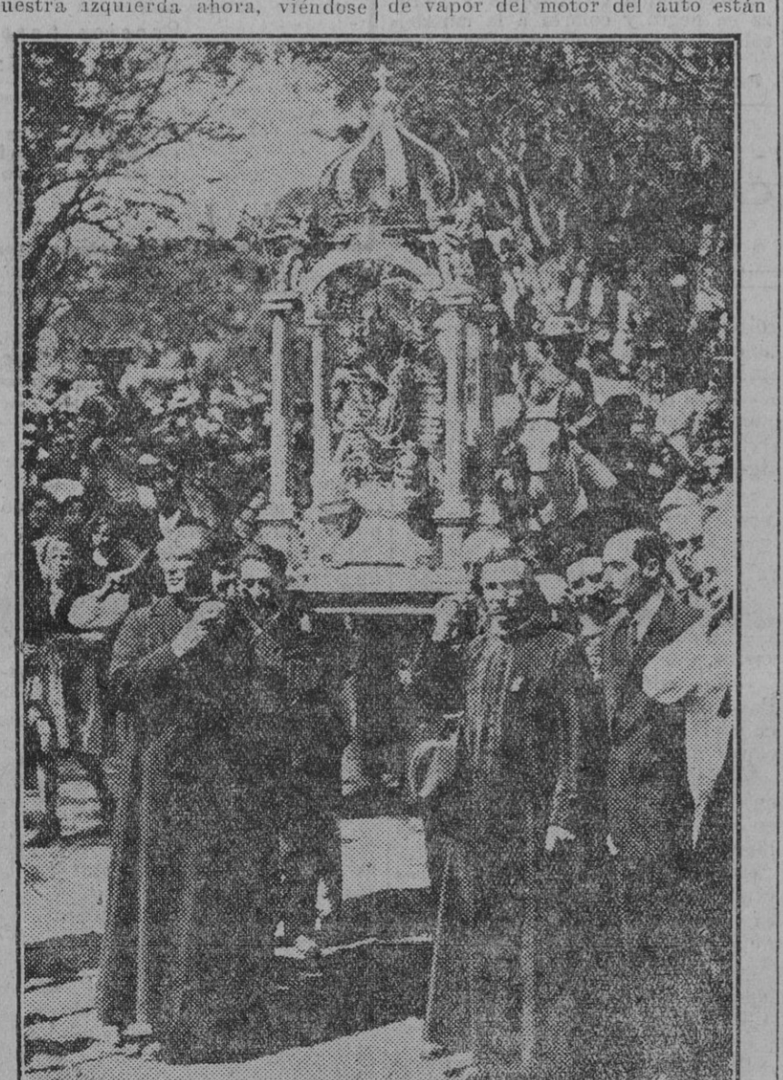
La imagen de la Virgen de los Angeles conducida en procesión por la meseta de la Peña.