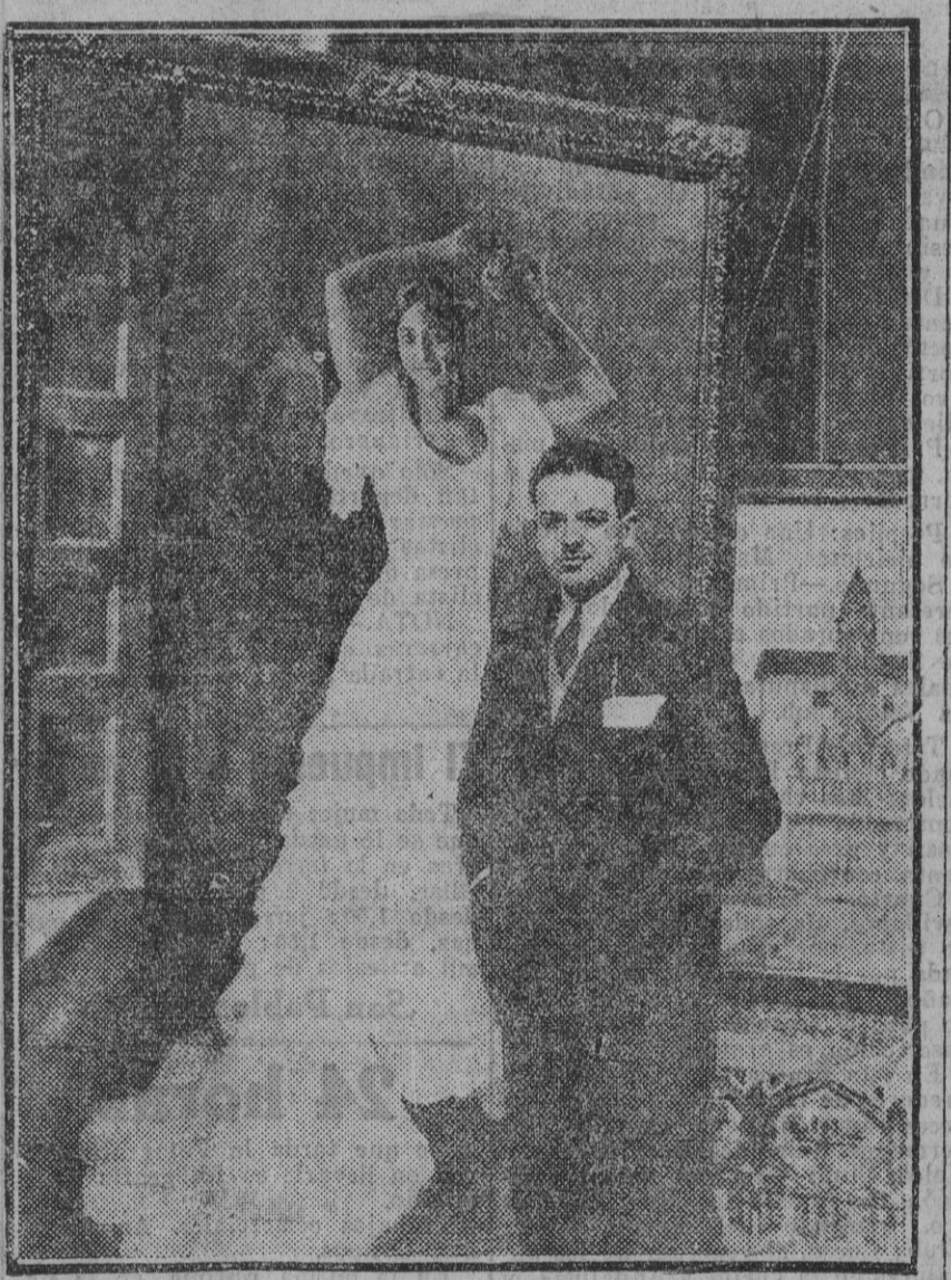
Alfonso Grosso, artista sevillano.

La sonrisa de esta mujer empieza en la boca y termina en la flor que espeluzna en su cabellera. Recibí muchas felicitaciones, porque la gente estaba deseosa de ver en los cuadros la alegría del sol español. Ese ha sido uno de los motivos del éxito que llegué á obtener: el