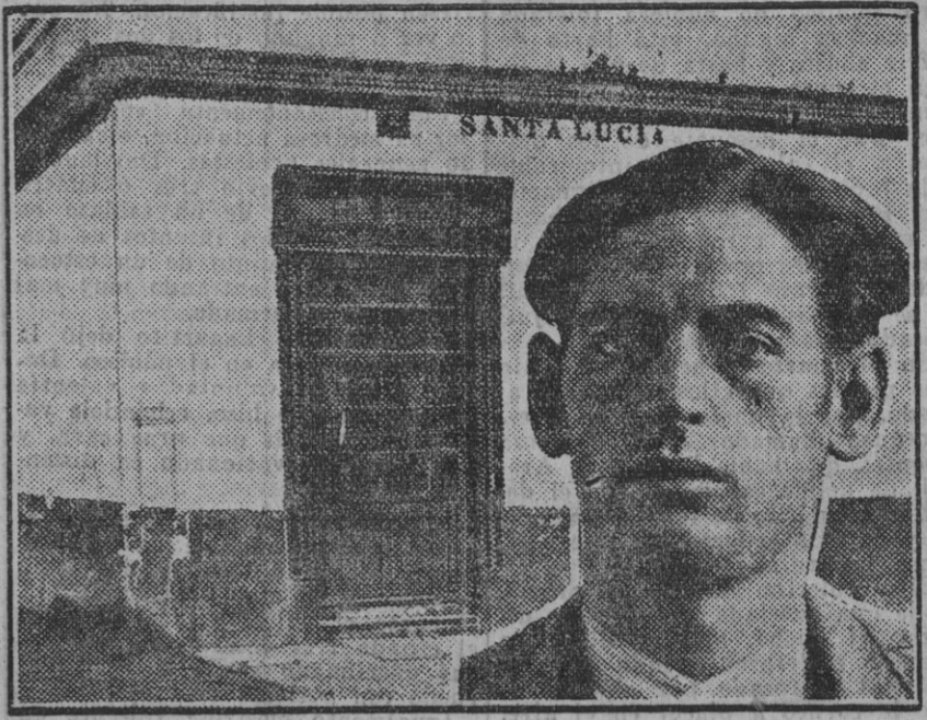
El estanco de la calle Santa Lucía donde el ex legionario (a la derecha del grabado) cometió el crimen.

Un noble alemán, que desde el fin de la guerra se encerró en su castillo de Sajonia, cuenta que una noche presenció desde su lecho la ceremonia nupcial de unos jóvenes de minutos, uno de los cuales, en nombre de los novios, le invitó al banquete. El noble, agradecido, les regaló un estuche del misterioso negro-sombra para los ojos, «Hano de Sándalo». Precio, 3,75. Fabricado por Floridia, creadora del supremo Jabón «Flores del Campo».