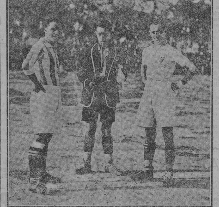
Los capitanes de los equipos y el «referee», antes de empezar el partido.

El partido tuvo momentos bonitos—muy pocos—y muchos de aburrimiento, debido al cuadro de