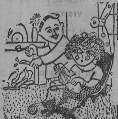
—Si no te echas al fuego por una mujer, ¿de qué eres entonces capaz? —De echarla a ella. (De Le Matin.)