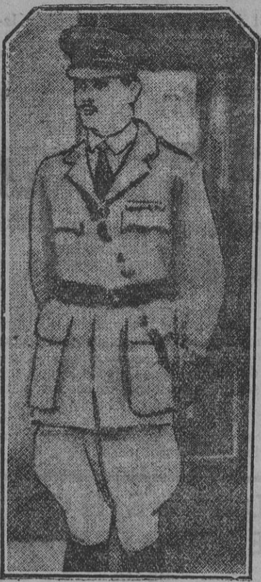
El príncipe Enrique, tercer hijo del Rey de Inglaterra, que va a contraer matrimonio con la hija del duque Montagu Douglas Scott.

Terminada la Conferencia de Locarno, el mundo puede pensar en un porvenir de paz. Desde el Tratado de Versalles, es decir, casi desde el fin de la guerra, se respiraba en Europa el ambiente cálido de otra posible confagración.