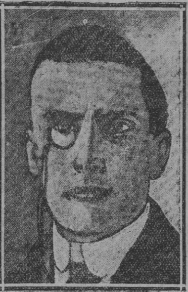
MR. CHAMBERLAIN bajo cuya presidencia inauguró sus sesiones la Conferencia de Locarno.