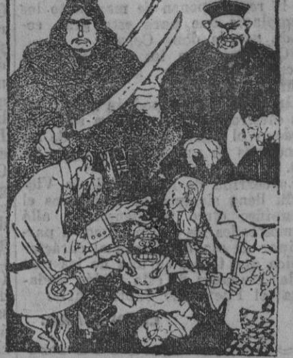
Francia é Inglaterra, harto preocupadas con un peligro inasumible, no habían advertido el verdadero peligro (Marruecos y China).