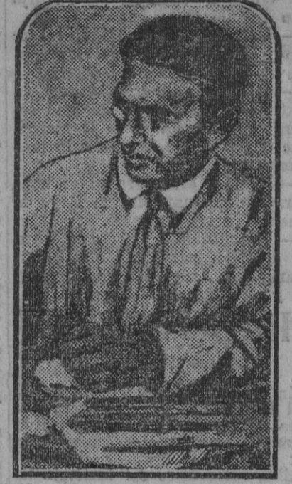
EL GENERAL ANDREWS

¿A quien el Presidente Coolidge ha otorgado plena confianza para que haga cumplir rigurosamente la ley seca y que ha anunciado para primer mes de Septiembre una vigorosa ofensiva contra los contrabandistas, sea contra el pabellón extranjero á que se acogan, para lo cual se propone llegar á acuerdos eficaces con distintos países.