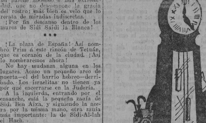
LA HORA POR LOGARITMOS

—No tenga usted duda; el reloj marcha admirablemente, sólo que hay que saber entenderlo. —Por ejemplo; cuando vea usted que señala las doce y dan cinco campanadas... son las dos y media.