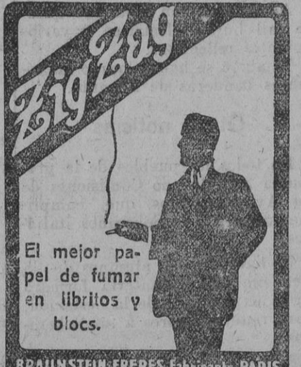
BRAUNSTEIN-FRERES Fabricants PARIS

Depositarío exclusivo para Andalucía y Gibraltar: