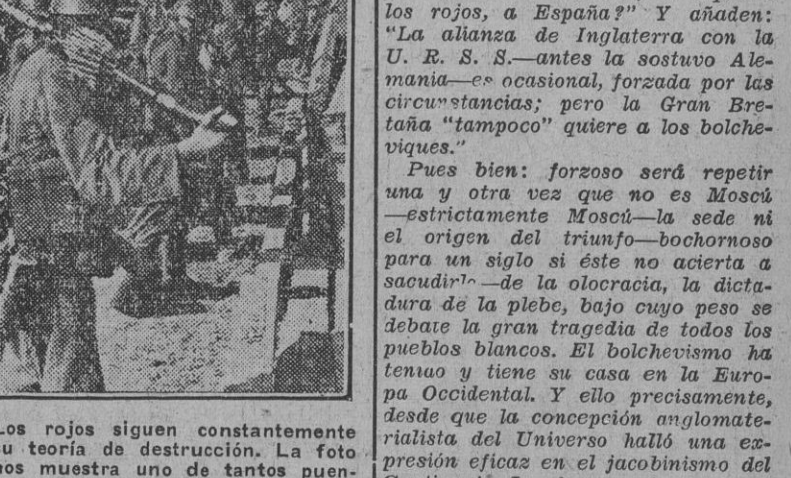
Los rojos siguen constantemente su teoría de destrucción. La foto nos muestra uno de tantos puntos volados por el Ejército ruso en derrota.

pleta, que están a disposición de los dos grupos mayores de la familia humana: el Imperio británico y los Estados Unidos, que, felizmente para el progreso y la humanidad, amplia medida tienen los mismos pensamientos o en todo caso tienen muchas concepciones similares. La entrevista fué, pues, simbólica. Este es un rasgo más importante. Un símbolo que todo el Mundo puede comprender en todos los países y en todas las partes del Mundo expresado en la profunda unidad de espíritu y en los momentos decisivos dirige a todos los pueblos de lengua inglesa en el Mundo entero.