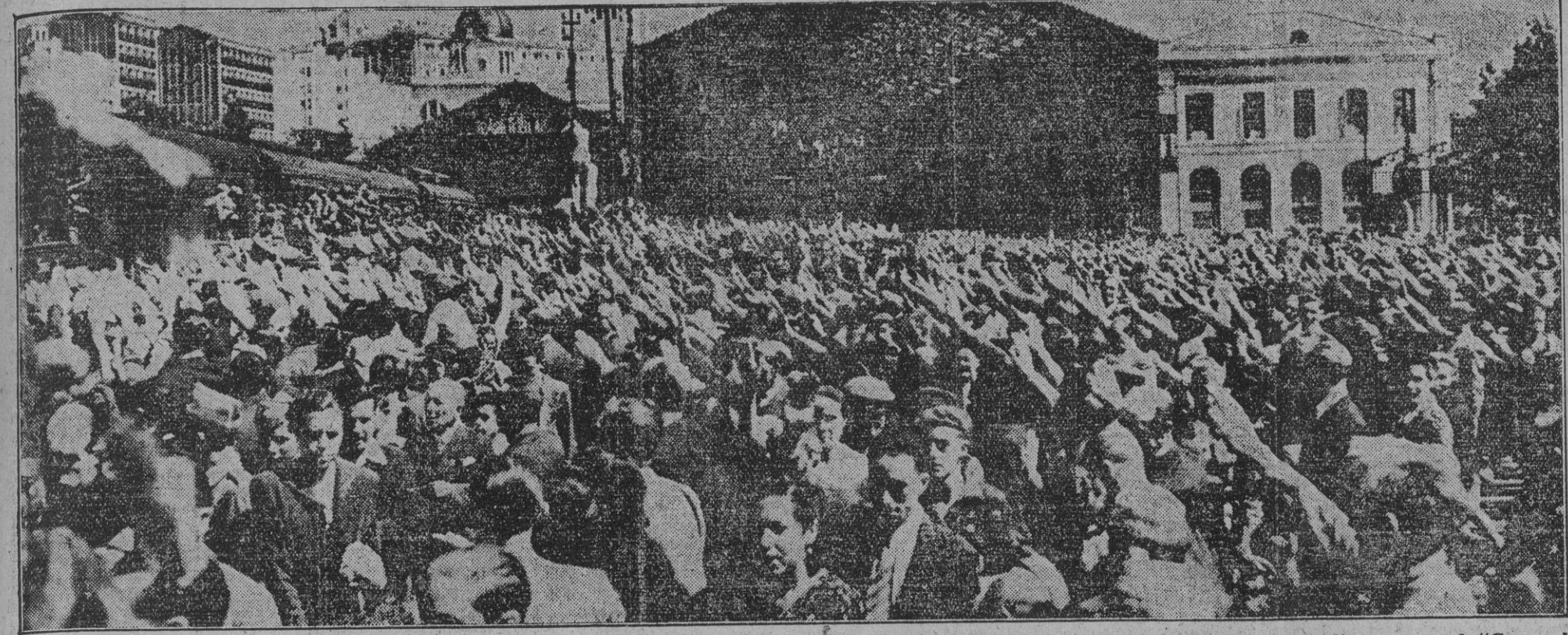
Ayer salieron nuevas expediciones de camaradas voluntarios de la División Azul, que van a luchar contra el comunismo. El pueblo de Madrid exteriorizó su entusiasmo y sentimiento patriótico al despedir en la estación del Norte a los bravos falangistas. Brazo en alto, el público canta el "Cara al sol" momentos antes de partir el tren que conduce a los jóvenes falangistas hacia la batalla.

también, sangre por sangre, amistad por amistad, a devolver a los grandes países que nos ayudaron en nuestra lucha... (Las aclamaciones a Alemania e Italia interrumpen las palabras del Presidente de la Junta Política.)