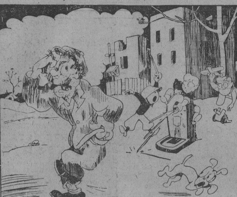
[Agua con él! ¡A ése! ¡A ése! ¡Aí... ataque en picado!]