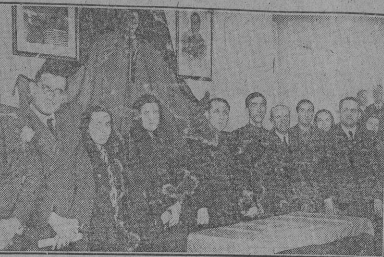
El jefe provincial del Movimiento de Córdoba en el acto de clausura de las conferencias para la formación nacionalsindicalista del Magisterio, que, organizado por el S. E. M., ha tenido efecto en la capital andaluza.