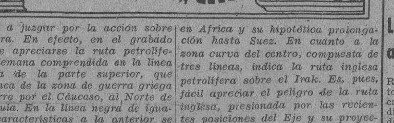
El reciente desembarco inglés en Basora, ciudad costera del Irak, ha llamado poderosamente la atención en los círculos políticos, que califican de "inquietante" tal actitud británica. La ruta petrolífera del Imperio inglés en el Oriente Medio, comprendida entre el mar Pérsico y el Mediterráneo, no tiene en la actualidad la seguridad deseada en Lon-