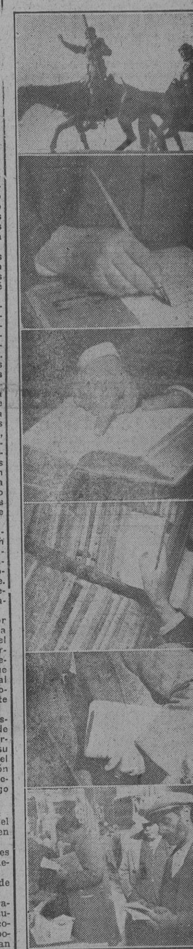
España conmemora mañana con la Fiesta del Libro el aniversario de la muerte de Cervantes. En Madrid, las Academias, la Cámara Oficial del Libro y otras instituciones solemnizarán la efeméride con severos actos que serán expresión de la espiritualidad y la cultura de nuestra Patria.