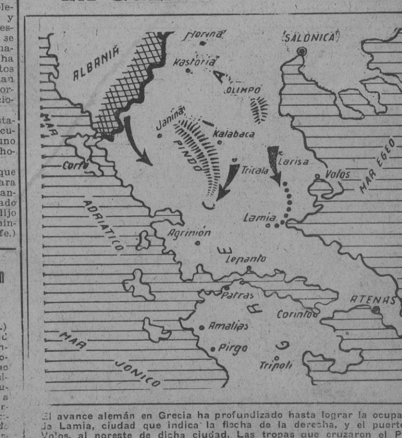
El avance alemán en Grecia ha profundizado hasta lograr la ocupación de Lamia, ciudad que indica la flecha de la derecha, y el puerto de Volos, al noreste de dicha ciudad. Las tropas que cruzaron el Pindo han cortado las carreteras que el Ejército greco-británico usaba para la retirada. Las otras dos flechas indican los posibles movimientos de las tropas del Reich.