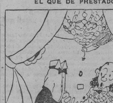
—No te extraña. Le ha prestado la camisa un amigo más alto que tú.

Tercera. El Japón ha de renunciar a su adhesión del Pacto tripartito.