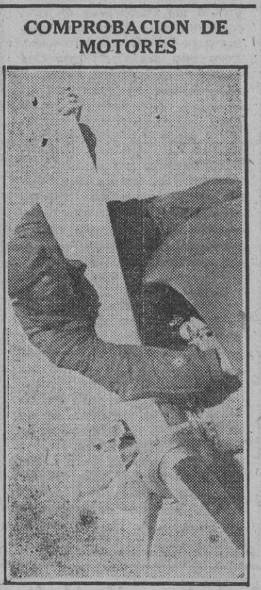
Los soldados auxiliares del Ejército aéreo alemán revisan y comprueban los motores de los aviones antes de iniciar los vuelos de destrucción de Inglaterra.

Matsvoka depositó después una corona ante el monumento a los Caídos. Dos horas más tarde continuó viaje en avión hacia Karbin. (Efe.)