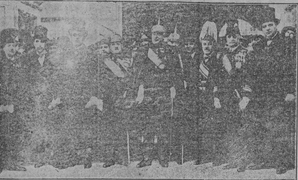
El general Primo de Rivera, con los ministros de su Gobierno civil, a la salida de Palacio.