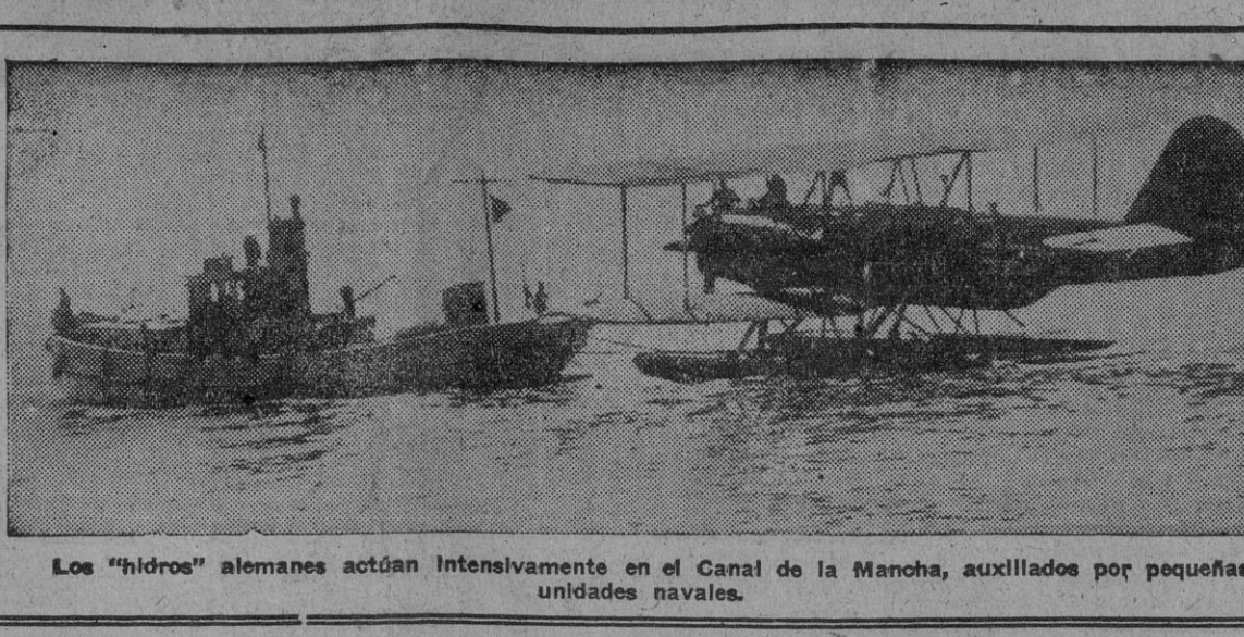
Los "hidros" alemanes actúan intensivamente en el Canal de la Mancha, auxiliados por pequeñas unidades navales.

"Reafirmamos nuestra amistad con Inglaterra" DICE EL PRESIDENTE TURCO Pero desea continuar al margen de la guerra ANKARA, 1.—El Presidente de la República Turca, Ismet Inonu, ha pronunciado un discurso con ocasión de la apertura de la Asamblea Nacional en el que dijo que la actitud no beligerante de Turquía no debe ser un obstáculo en el mantenimiento de relaciones cordiales con todos los países. "Después de la apertura precedente de la Cámara—dijo Inonu—explícame cuál era nuestra política en relación con la guerra actual. Ningún cambio en la guerra actual, el momento en que Inglaterra prosigue, a pesar de las dificultades, la lucha heroica por su existencia, es nuestro deber afirmar nuevamente nuestra amistad hacia ella y nuestra alianza con ella."