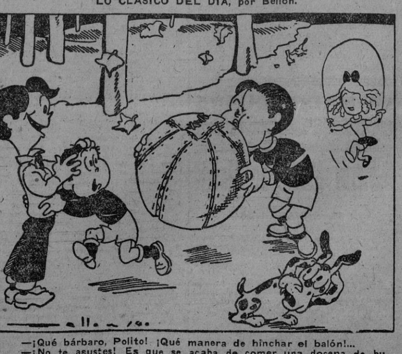
¡Qué bárbaro. ¡Polito! ¡Qué manera de hinchar el balón!... ¡No te asustes! Es que se acaba de comer una docena de buñuelos de viento...

Vivo fuego artillero en el Epiro ATENAS, 21.—Comunicado oficial griego facilitado a primera hora de la mañana y correspondiente al día de ayer. "En el frente del Epiro hubo vivo fuego de artillería entre ambos adversarios. En el sector de Florina, nuestros destacamentos lograron vencer la tenaz resistencia enemiga y penetrar, en una profundidad de cincos kilómetros, en territorio enemigo, conquistando a la bayoneta posiciones fortificadas del enemigo. Hicimos prisioneros nueve oficiales y ciento cincuenta hombres y nos apoderamos de ganado. Los raids enemigos fueron efectuados sobre quince pueblos y aldeas y resultaron muertos noventa y tres personas, resultando heridas sesenta y cinco."