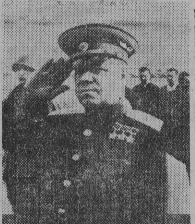
Zukov, jefe del ejército ruso, el tirano que ha impuesto sus brutales métodos en Hungría.

ka en Polonia — les parece un héroe. En cuanto a Gomulka, personas que le conocen bien me han dicho que es infinitamente más peligroso que cualquier otro jefe bolchevique. El stalinista Ochar era una especie de bestia que aparecía en las recepciones diplomáticas sin corbata, despeinado y soltando barbaridades. Gomulka es un refinado intelectualoido, de cerebro perfectamente moldeado en el marxismo. Comunismo, pero en la línea de lo que se llama el comunismo de zapatos limpios, que inauguró Malenkov y sigue Kruschchev. Su misión es convencer a los occidentales de que este comunismo puede ser amigo o al menos el mal menor. En cuanto a los pueblos que tenían que soportarlo, al menor intento de protesta se les echó encima cinco mil tanques y siete di-