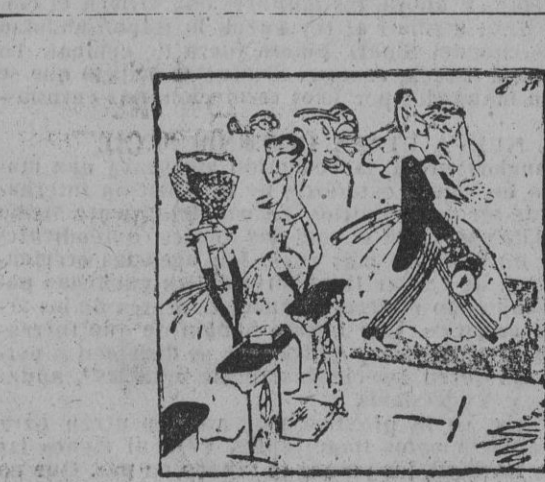
de es capaz de llegar para darme celos.