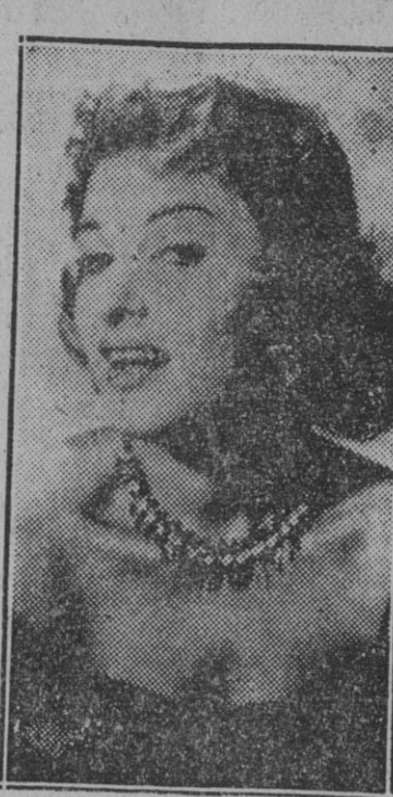
Silvana Pampanini, protagonista de la gran película «La bella de Roma», que «Rey Soria Films» presenta hoy en las pantallas de los cines Cristina y Astoria.

El gamberismo es una lacra social internacional desarrollada en nuestro siglo en forma tan alarmante que en muchos países han debido extremarse las medidas coercitivas en beneficio de la salud pública. Esta circunstancia hace del film de Juan Antonio Bardem «Calle Mayor» una obra de universal trascendencia, aún cuando su acción no está localizada en un país determinado. «Calle Mayor» es una película de raíces humanas profundamente arraigadas en la sociedad de nuestro tiempo. De ahí que el problema de su protagonista, encarnada por Betsy Blair con una emotividad que cala el espíritu del público, encuentra una resonancia extraordinaria no sólo en los espectadores de fina sensibilidad, sino también en aquellos que en algún momento pudieran sentirse representados por el personaje que encarna José Suárez, autor de la broma cruel y