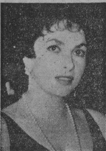
Gina Lollobrigida, protagonista del excepcional film «Trapecio», que C. B. Films presentará próximamente

Con motivo de la proyección privada de «Trapecio», extraordinario film de inmediato estreno, en nuestra ciudad, fué atentamente invitado un selecto grupo de críticos cinematográficos