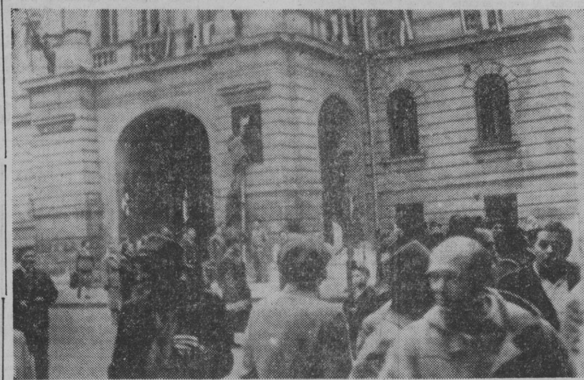
Una vista del Ayuntamiento de Budapest en el que los nacionalistas húngaros hicieron ondear la bandera nacional sin la estrella soviética.

«No insistas, no puedo ponerme el abrigo hasta el primero de noviembre... ¡Qué dirían en la oficina!»