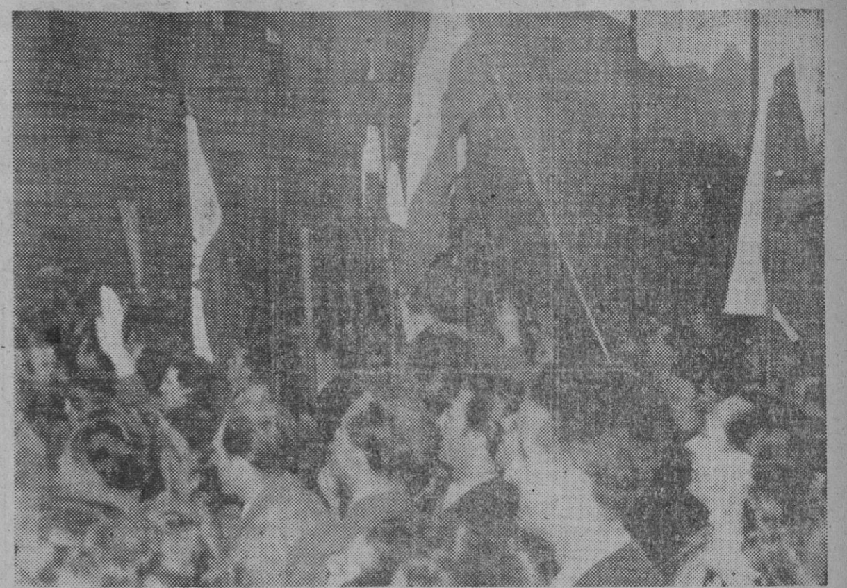
Una imponente manifestación de los nacionalistas húngaros en Budapest, en la que puede verse a los manifestantes llevando banderas nacionales en las que ha sido arrancada la estrella roja.

neutralidad, pide la normalización de la vida en Hungría y el restablecimiento de la libertad de acuerdo con la Carta de Derechos Humanos".