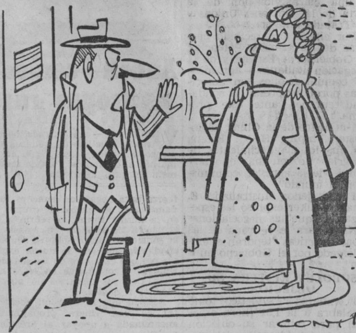
— No insistas, no puedo ponerme el abrigo hasta el primero de noviembre... ¡Qué dirían en la oficina!