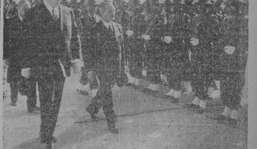
El ministro español de Asuntos Exteriores, señor Martín Artajo, acompañado de su colega turco, Ethem Menderes, pasa revista a las fuerzas que le rindieron honores a su llegada al aeropuerto de Esenboga, en Ankara.