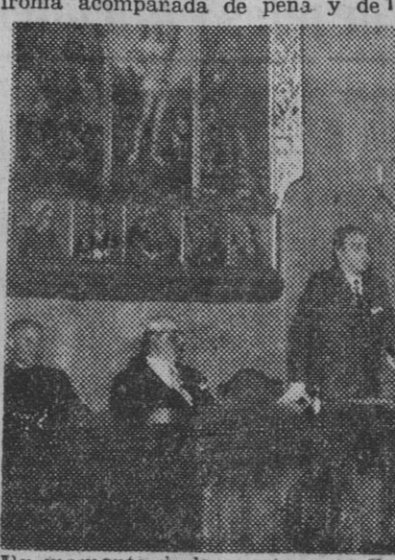
Un momento de la apertura de Curso en el Instituto «Sallarés Pla»