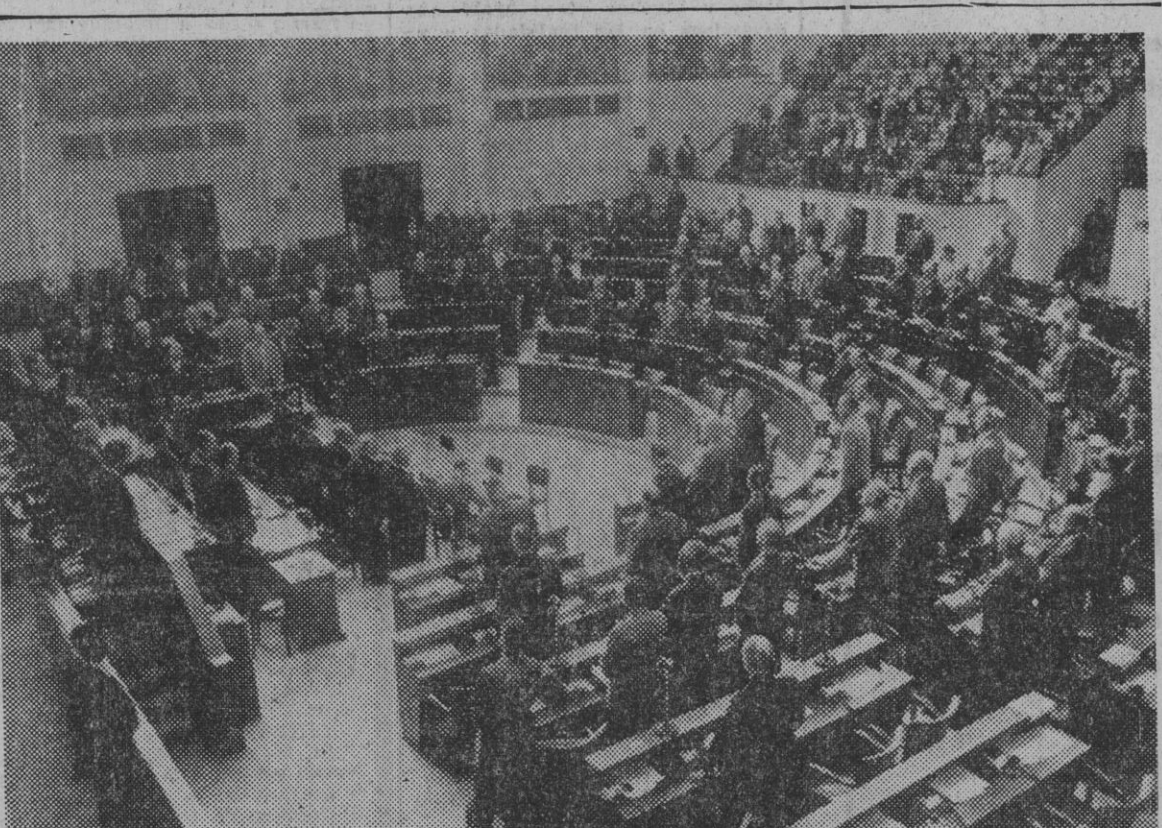
ESTRASBURGO. — Una vista del salón donde se celebrará la sesión de apertura del Consejo de Europa. Los asambleístas guardando un minuto de silencio a la memoria del último secretario del Consejo, Leon Marshall.

A partir de hoy, el número de teléfono de la Sección de Publicidad Comercial es el 23-12-06