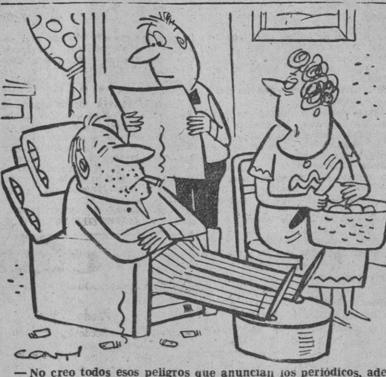
No creo todos esos peligros que anuncian los periódicos, además, estoy seguro que un poco de radiactividad a tu padre le sentaría muy bien...