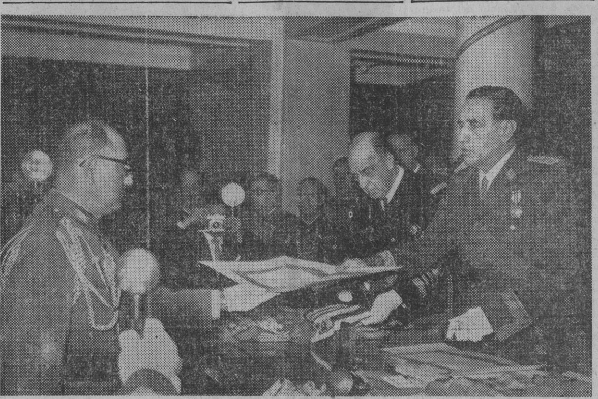
MADRID. — Los ministros del Ejército, Marina y Aire, durante la imposición de fajines a los componentes de la LI promoción de jefes y oficiales de Estado Mayor, con la asistencia de otros generales.