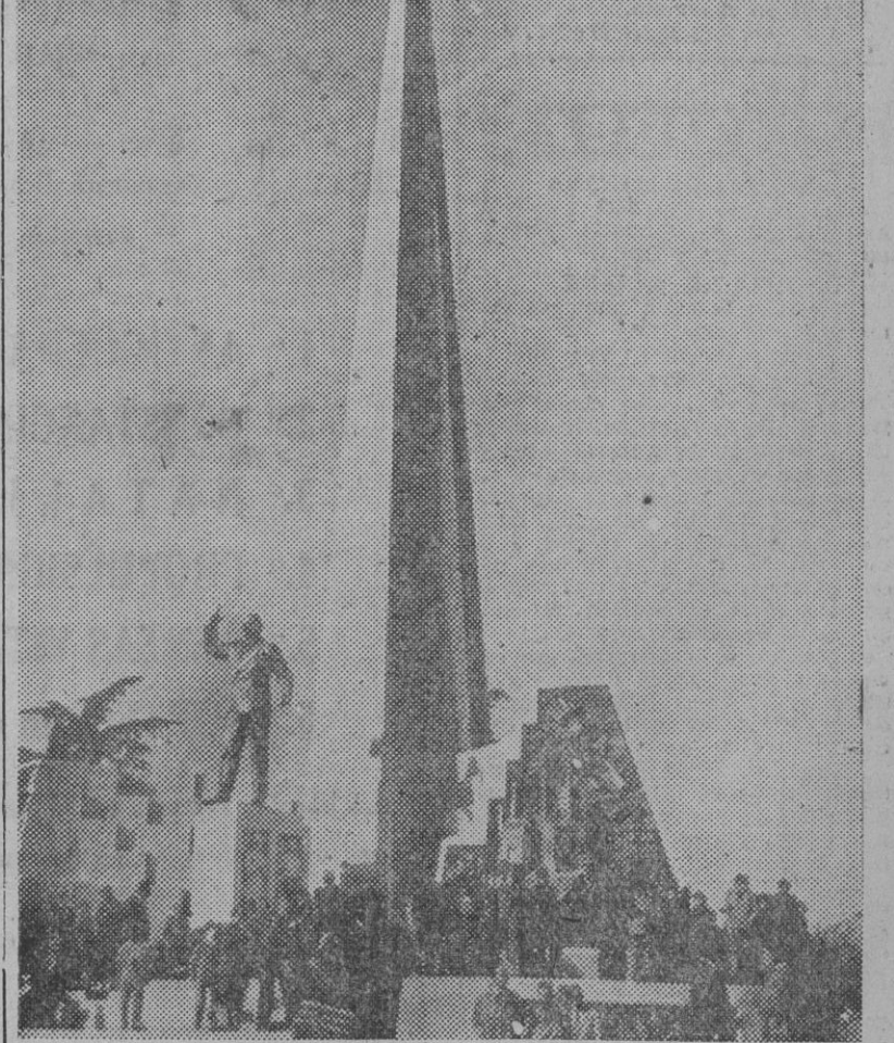
TRENTO. — Vista del monumento erigido a la memoria del ex primer ministro italiano, Alcide de Gasperi, inaugurado en esta ciudad del norte de Italia, coincidiendo con la celebración del Congreso del partido democristiano de Italia.