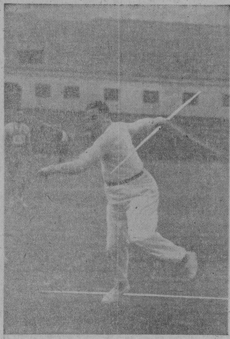
Este es el nuevo estilo español en el lanzamiento de jabalina, que ha revolucionado esta especialidad. Resultado: 74,32 metros, nuevo record nacional.