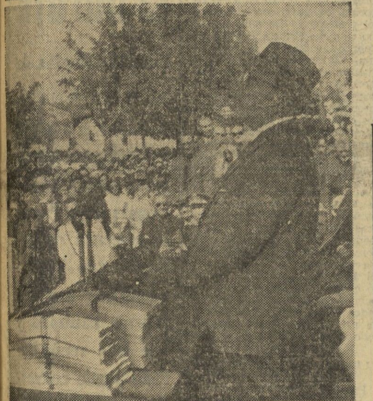
S. E. el Jefe del Estado pronunciando su importante discurso, en Valdecazaza, en el acto de entrega de títulos a los adjudicatarios de parcelas, huertos y viviendas del nuevo pueblo.

Pantano de Valuengo en el río Ardila con zona propia de riego. Las posibilidades de embalse son muy superiores a las necesidades de la zona regable.