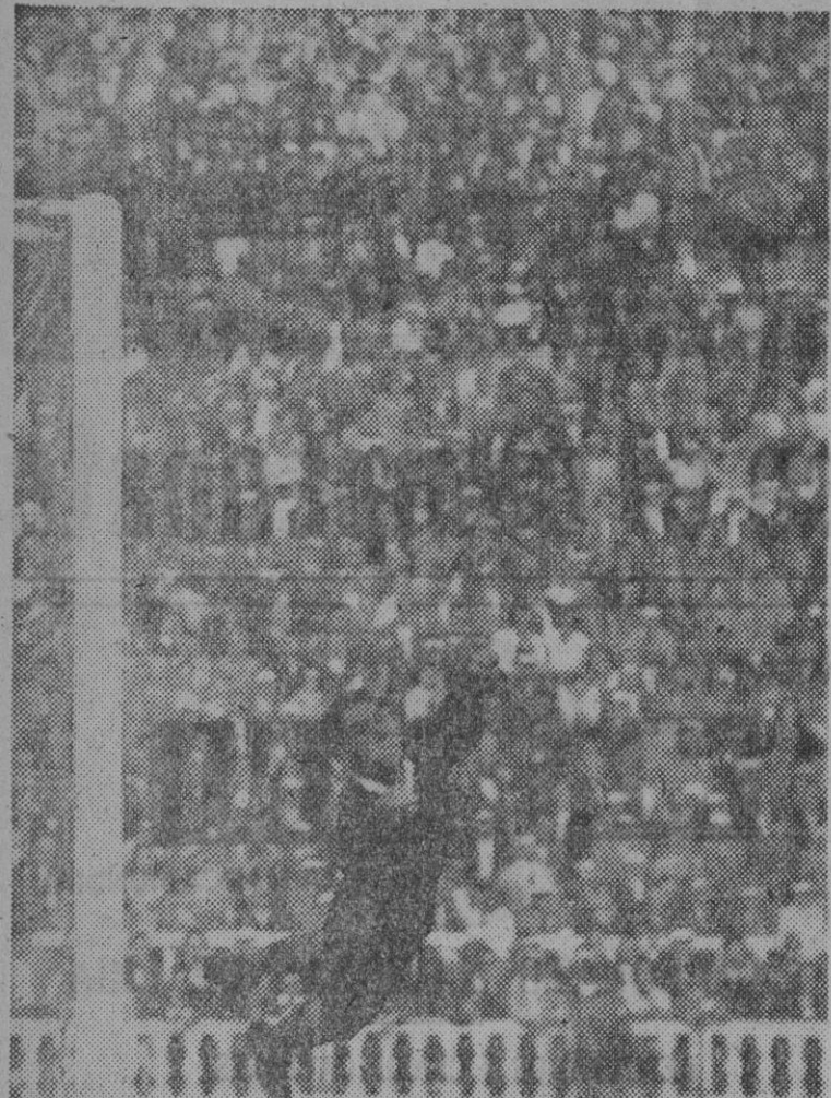
Sólo en la primera mitad del partido, la delantera coruñesa, apoyada en la velocidad de sus extremos y en la escurridiza infiltración de su interior Bazán, logró inquietar la meta barcelonista.

Vertical text on the far right edge, partially cut off, containing various news snippets and advertisements.