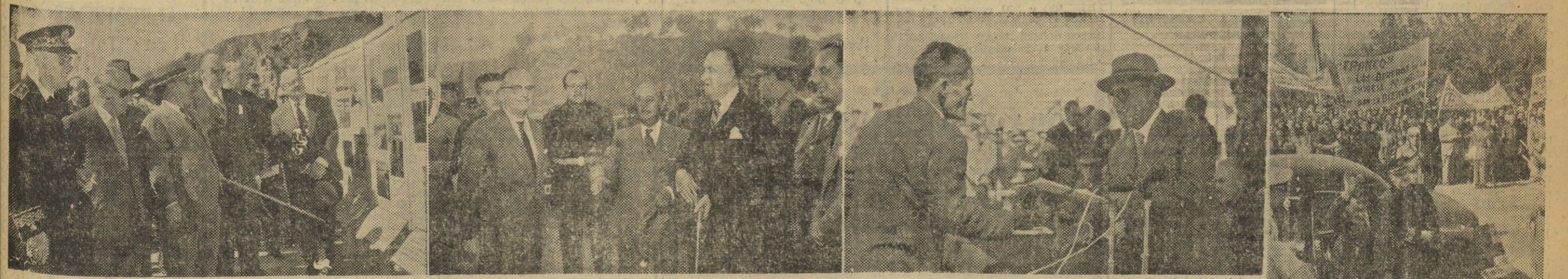
1. El Generalísimo y personalidades de su séquito durante la inauguración y bendición del pantano y central eléctrica de Cijara. — 2. Franco durante su visita a las obras en construcción de la nueva presa de Orellana, acompañado del ministro de Obras Públicas, conde de Vallellano, y otras personalidades. — 3. El Caudillo entregando los títulos de propiedad de parcelas, huertos familiares y viviendas a los beneficiarios, en Valdecazaza. — 4. Llegada de S. E. en compañía del ministro de Agricultura, señor Cavestany, al nuevo pueblo de Valdecazaza.