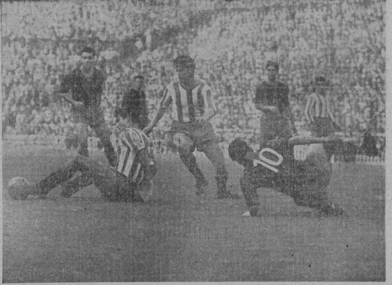
La técnica del partido la dió un apolotonamiento absurdo en cuantas ocasiones la bola rondó el marco coruñés. Replegados los jugadores gallegos ante el mayor dominio azulgrana...