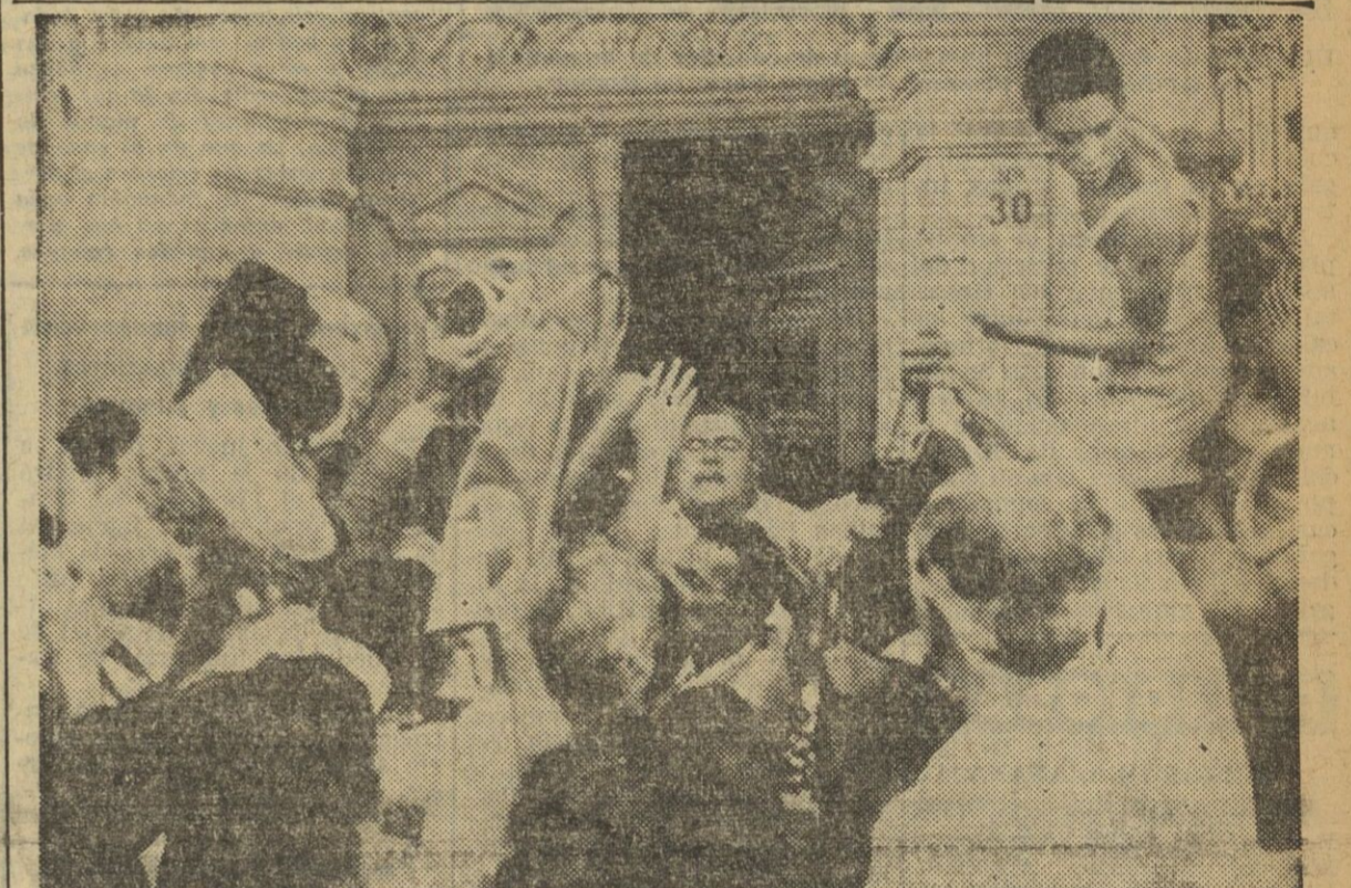
Mujeres y niños se disputan los alimentos de un comercio de Nicosia, durante las dos horas de plazo concedidas por las fuerzas británicas para que los residentes en la ciudad puedan permanecer fuera de sus domicilios.