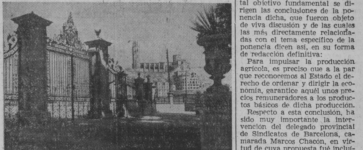
Entrada a los Campos Elisios de Lérida, donde actualmente se celebra la brillantísima Feria de Muestras de San Miguel, revelación de la fabulosa coyuntura de engrandecimiento en que se encuentra la ciudad y su provincia. Al fondo la Catedral vieja, maravilla de la arquitectura gótica, que durante la guerra de Sucesión, fue convertida en cuartel y que el Estado está reconstruyendo.

Labradores y Ganaderos, que en breve se celebrará en Madrid. Todo esto guarda estrecha relación entre sí, porque el aprovechamiento integral del Noguera Ribagorzana abre amplias posibilidades en orden a la industrialización de los productos del campo y a la mayor extensión de los regadíos; en la Feria, predominantemente agrícola, se hallan de manifiesto los enormes progresos logrados y a punto de lograrse en estas y otras materias análogas y en multitud de aspectos afines, y, en fin, las intensas tareas del Congreso han tenido por objeto estudiar numerosos y fundamentales problemas del campo y proponer las correspondientes soluciones adecuadas. A ellas vamos a referirnos muy especialmente ahora.