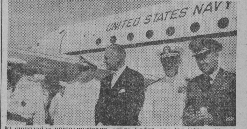
El embajador norteamericano, señor Lodge, con los jefes militares y navales norteamericanos y españoles, que inauguraron el aeropuerto naval de Rota.

ROTA (Cádiz), 5.— Un avión norteamericano el embajador de los Estados Unidos, señor Lodge, acompañado de los almirantes españoles señores Bustamante y Abarzuza, y de los americanos señores Boone, Homer y Byington; general Kissner, y otros jefes de la Misión