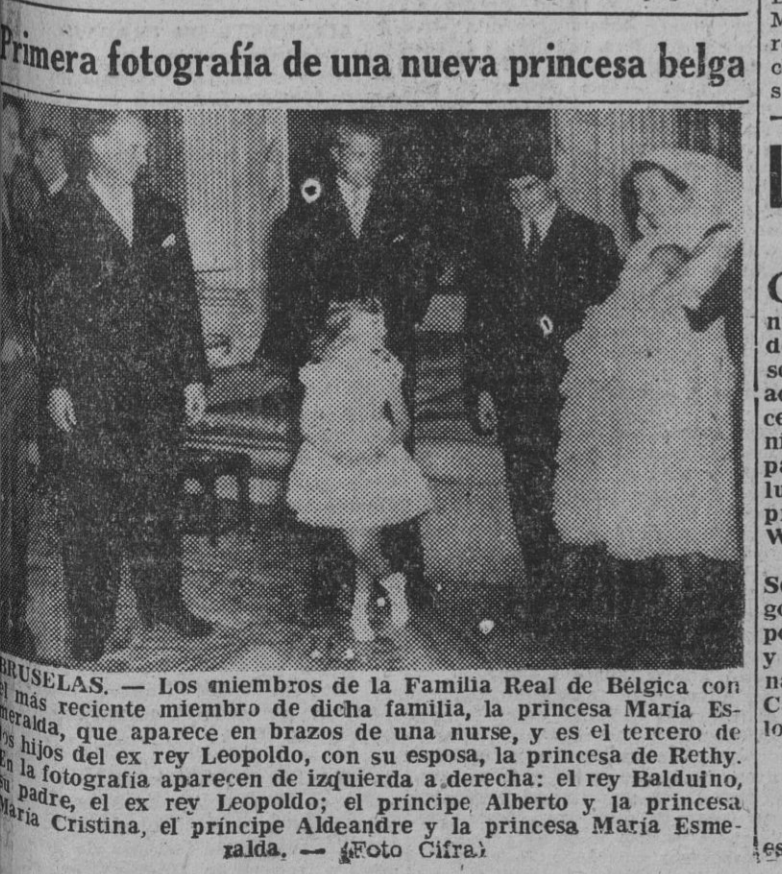
Primera fotografía de una nueva princesa belga

OBRAS REALIZADAS El ministro de Agricultura y director general del Instituto Nacional de Colonización, explicando al Generalísimo las principales características de la labor realizada, que ha consistido, principalmente, en la transformación en regadío, mediante elevaciones en el Río Tajo, de los terrenos de vega pertenecientes al término de Pueblanueva; la zona ha quedado dividida en tres sectores, con una superficie total de 1.120 hectáreas, habiéndose construido dos estaciones elevadoras de agua, así como la línea eléctrica desde Talavera a la estación elevadora en Bernuy, con un recorrido de 25 kilómetros y tensión de 33.000 voltios, que proporciona energía a las elevaciones y poblados de la zona y de Bernuy. Asimismo se han construido un camino de unión de los dos pueblos, Bernuy y Las Vegas, con longitud de once kilómetros; un canal principal derivado de la elevación de Hijares, con desarrollo de 3.208 metros; un puente-acueducto para el paso del camino y canalizados sobre el río Sangrera; redes de acequias, desagües y caminos y nivelación de las 438 hectáreas, objeto de colonización directa.