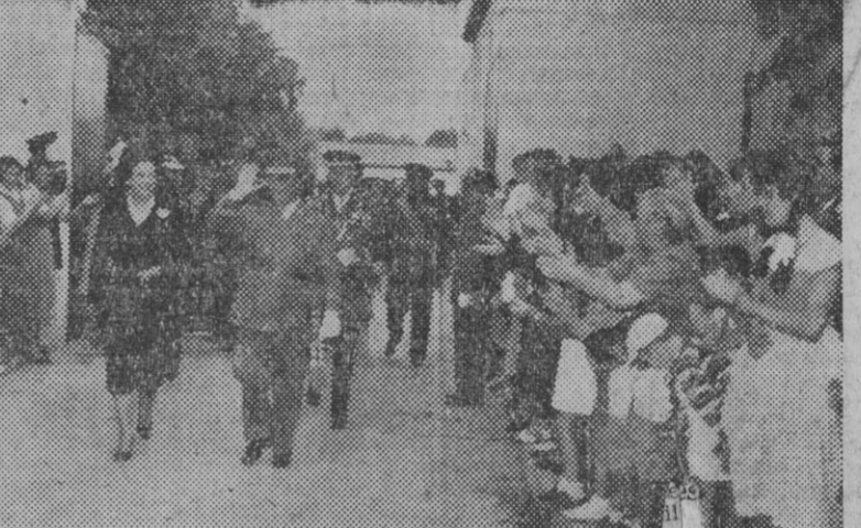
Con motivo de la fiesta onomástica de S. E. el Jefe del Estado, se celebró ayer, en El Pardo, una solemne misa. Las fotografías recogen una panorámica del lugar en donde se ofició el Santo Sacrificio, y al Caudillo acompañado de su egregia esposa, aplaudidos por el vecindario cuando se dirigían al mencionado acto religioso.

En esta zona se han construido 80 viviendas de colonos y 20 de obreros en Las Vegas y 8 y 7, respectivamente, en el núcleo de San Antonio. Se han levantado, además, 209 pequeños albergues de temporada, diseminados en los huertos establecidos de la zona para los obreros residentes en Pueblanueva. En esta población se construye actualmente un Grupo Escolar compuesto de dos escuelas de niñas y dos de niños, con sus correspondientes viviendas para maestros.