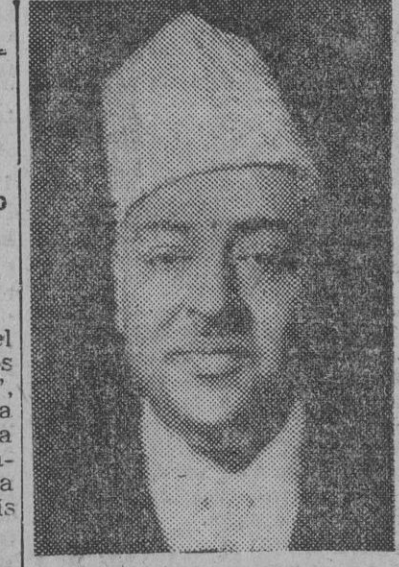
Esta es la mayor expulsión en masa ordenada por el joven Estado marroquí, e indudablemente aumentará la tirantéz entre Francia y su antiguo protectorado. — Efe.

En el avión también van seis inspectores franceses de la «Sûreté Nationale» marroquí, que se negaron a detener a sus compatriotas. Todos ellos van vigilados por cinco inspectores marroquíes. Otros cuatro franceses que se refugiaron en la Embajada de su país al conocer la orden de expulsión, han salido ya con dirección a Burdeos. El resto de los expulsados fueron conducidos hasta la frontera argelina.