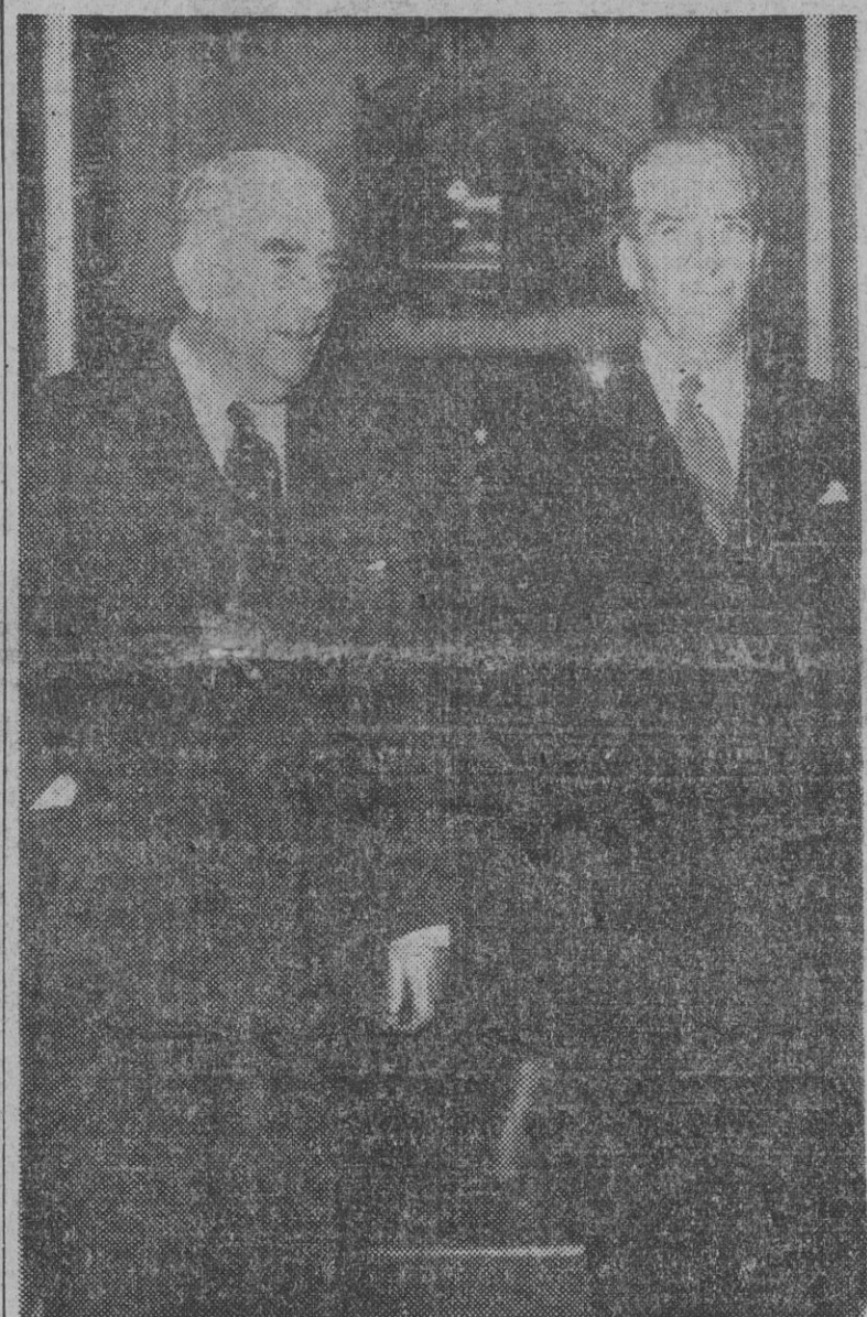
LONDRES. — El primer ministro británico, Mr. Eden, y el presidente de la Comisión pentapartita que presentó la propuesta de la Conferencia de Londres sobre el Canal de Suez al presidente egipcio, fotografiados en Downing Street después del almuerzo que ambos tuvieron y durante el cual se trató de la grave situación creada por el presidente Nasser ante su negativa a dicho plan.

6) Cuando Eden ha hablado de «ocupación» ha pretendido ignorar el hecho de que se ha garantizado una justa compensación a los accionistas de la Compañía del Canal de Suez. 7) No solamente Rusia, sino también la India, Ceilán e Indonesia, han planteado propuestas para una solución en las que se descarta el control internacional. 8) Refiriéndose a la propuesta de Eden sobre la supuesta violación egipcia de la Convención de 1888, si se intenta interferir el Canal mediante la creación de una Asociación de Usuarios, hay que preguntar a Eden «sobre qué artículo de la misma Convención basa la semejante solución o en qué norma de derecho internacional puede encontrar un precedente que la apoye». — Efe.