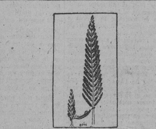
Me pareció que estos árboles no crecen igual.