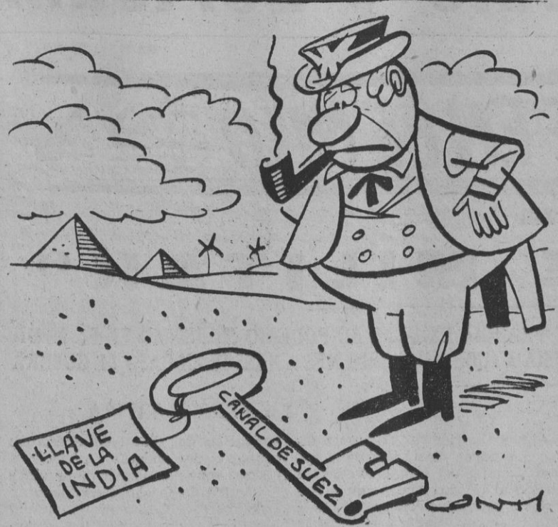
¡Tanto discutir por eso y después de todo cada día me sirve menos!