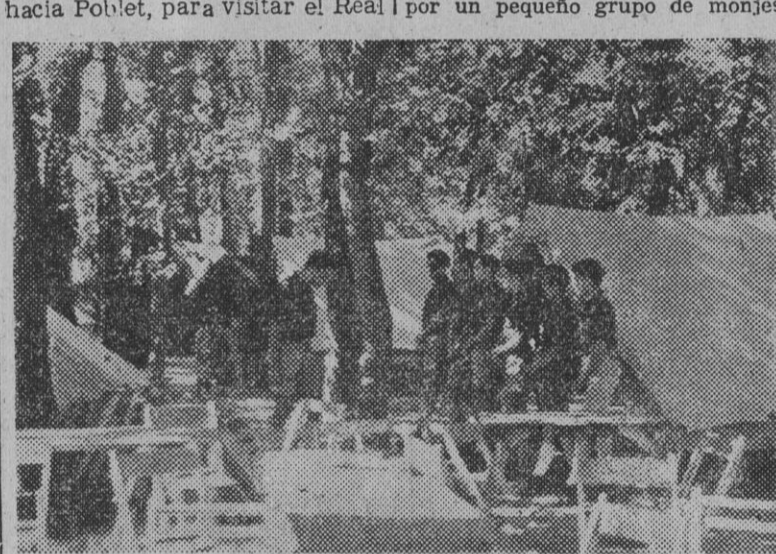
La revista en el Campamento de Santas Creus, durante la marcha del Frente de Juventudes de Barcelona hacia Montserrat.

italianos. Desde entonces, hemos vuelto alguna que otra vez, pero siempre muy rápidamente. Y ahora, con alguna detención, hemos podido ir comparando cómo estaba el Monasterio hace catorce años y cómo, gracias a Dios, se encuentra ya. La transformación ha sido inmensa. Y al considerar que nuestra Patria ha hecho esto, no puede uno menos de reafirmarse vigorosamente en el orgullo de ser español, en la convicción de que ser español es una de las pocas cosas serias que se puede ser en el mundo.