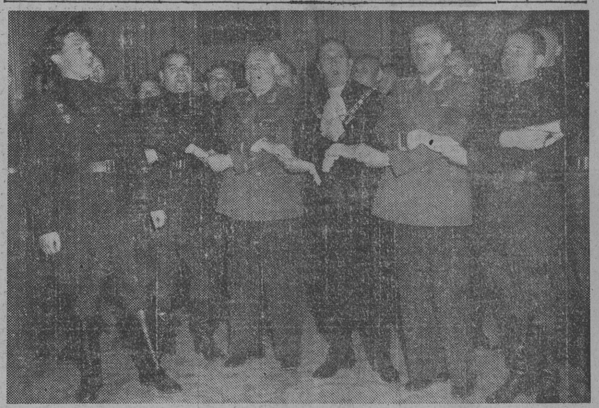
Durante la visita que unos miembros de las fuerzas armadas soviéticas realizaron a Inglaterra, el fotógrafo captó este momento en que los militares comunistas cantan "al alimón" con el alcalde de Londres, un himno cuyo son se sabían tan bien los ingleses como los soviéticos. Ese militar destacado en el centro, con pose de tenore italiano, es el que actúa de solista.