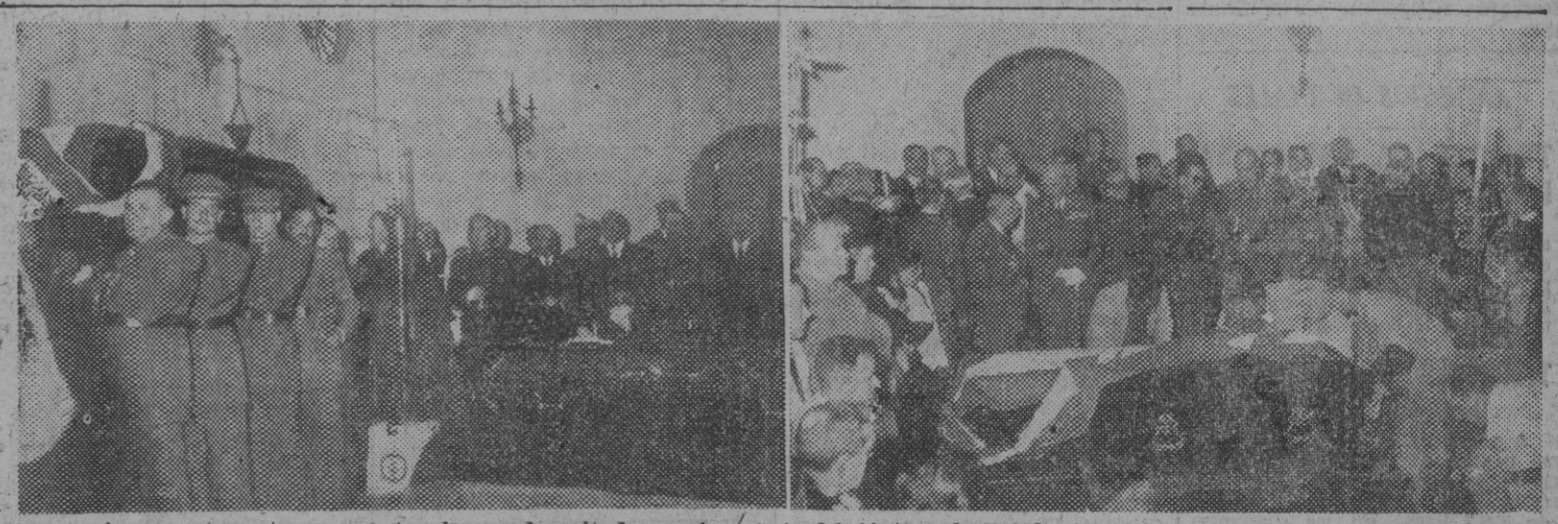
He aquí dos emocionantes momentos de ser depositados en la cripta del Alcázar de Toledo, juntamente con los de sus hijos don José y don Luis, los restos del heroico y laureado general, don José Moscardo Ituarte.

REPERCUSION UNIVERSAL DEL FALLECIMIENTO DEL GENERAL MOSCARDON INFORMACION EN 9.ª PAGINA