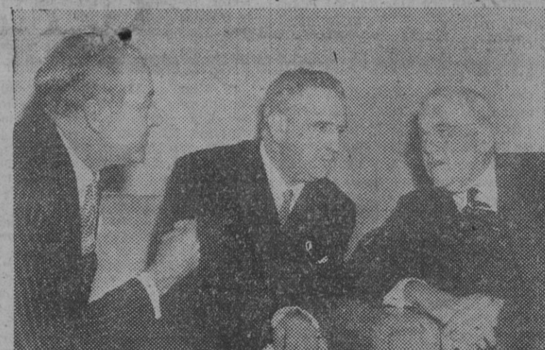
WASHINGTON. — El señor Martín Artajo, acompañado del embajador de España en esta capital, señor Aréiza, durante una de las entrevistas sostenidas con el secretario de Estado norteamericano, Mr. Foster Dulles, con motivo de su viaje a los Estados Unidos.