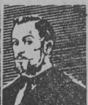
Pepe Iglesias, «El Zorro», el genial cómico de la radio y el teatro americano, que esta noche se presenta en el teatro Cómico con el estreno de «Paso al Zorro!».

«Los crímenes del Museo de Cera», en el Tivoli