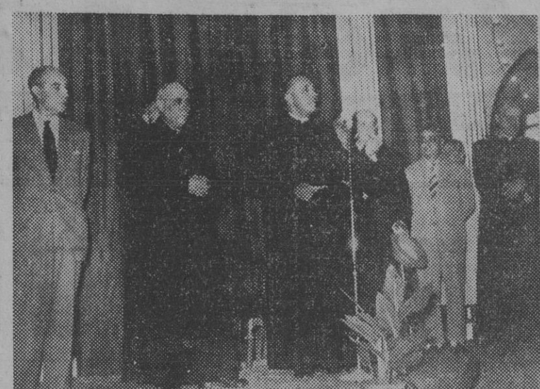
Ha llegado a nuestra ciudad el general de las Congregaciones Salesianas, Padre Renato Ziggiotti. En la primera fotografía el ilustrado religioso, durante el discurso que ha pronunciado en el Colegio de los Salesianos...