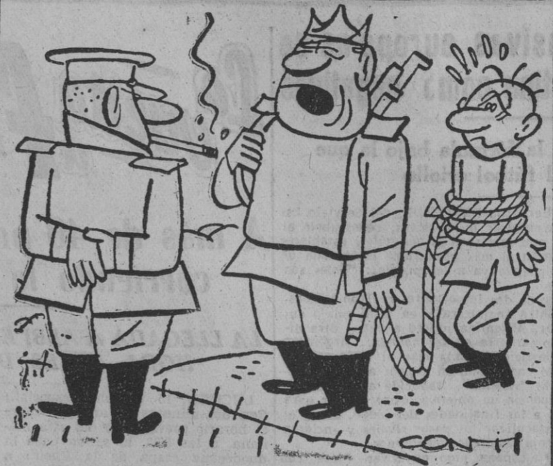
— He detenido a otro traidor. Confesó plenamente que hace quince años jugó una partida de mus con Beria.