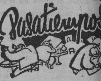
Jeroglífico núm. 3.622. ¿TE LO DIJO ALGUIEN DE MI FAMILIA?

LONDRES, 15. — Se confirma que el capitán de Aviación, Townsend, ha salido para su nuevo cargo de agregado aéreo en Bélgica, dos días antes de que la princesa Margarita regresara a Londres. — Efe.