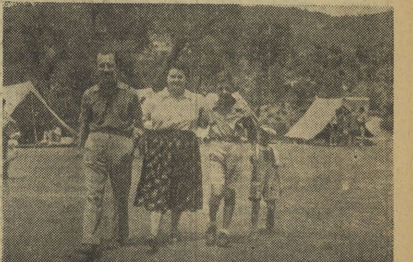
El pasado domingo los familiares de los muchachos que disfrutaban su época de descanso en los campamentos del Frente de Juventudes, efectuaron una visita a los acampados pasando la mayor parte del día en su compañía. La fotografía recoge una escena familiar a la hora de las despedidas.