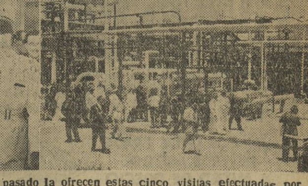
El año 1952 ha sido pródigo en realizaciones industriales y de todo orden en nuestra Patria. Una prueba del enorme incremento industrial que España ha experimentado en el año pasado lo ofrecen estas cinco vistas efectuadas por S. E. el jefe del Estado, Generalísimo Franco, a otros tantos centros industriales, pantanos y obras cívicas y que hoy reproducimos como resumen del favorable balance. — I. Inauguración del pantano del Ebro. — II. Visita al complejo industrial de Puertollano. — III. Franco examina la maqueta para la construcción de cinco mil viviendas en el Ferrol del Cid Gillo. — IV. El Generalísimo durante una de sus visitas al complejo industrial de Puertollano. — V. La reinería de Escobreros, en Cartagena.