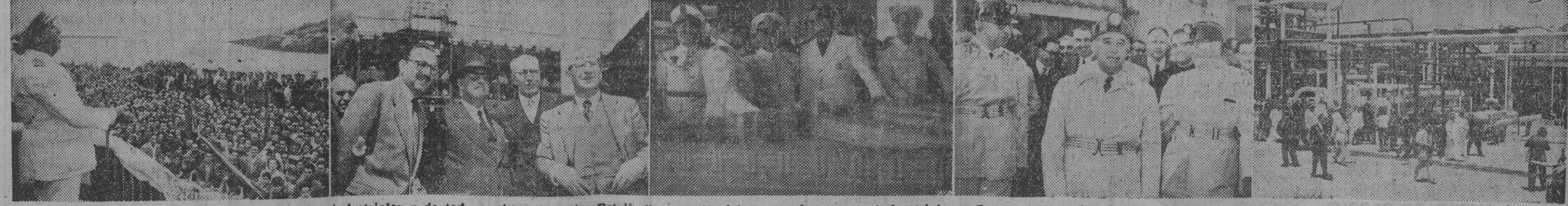
El año 1952 ha sido pródigo en realizaciones industriales y de todo orden en nuestra Patria. Una prueba del enorme incremento industrial que España ha experimentado en el año pasado la ofrecen estas cinco visitas efectuadas por S. E. el Jefe del Estado, Generalísimo Franco, a otros tantos centros industriales, pantanos y obras sociales y que hoy reproducimos como resumen del favorable balance. — I. Inauguración del pantano del Ebro. — II. Visita al complejo industrial de Puertollano. — III. Franco examina la maqueta para la construcción de cinco mil viviendas en el Ferrol del Cau dillo. — IV. El Generalísimo durante otra de sus visitas al complejo industrial de Puertollano. — V. La refinería de Escambreras, en Cartagena.

Si la encendida y juvenil inspiración de los precursores de nuestro Movimiento acertó a compendiar toda una política en España Una, Grande y Libre, por medio de la Patria, el Pan y la Justicia, quedan para otros sin descender para nada del espíritu realista y práctico más exigente, necesitamos abordar el replanteamiento de las condiciones sociales y económicas de los productores, de acuerdo con las necesidades orgánicas y funcionales de los establecimientos de esa Justicia. Todos los miramientos, todas las precauciones, todas las garantías, todos los contrastes que se quieran para traducir en hechos nuestro ardiente ideal. Nada de arbitristas, ni de utopías, ni de proyectos arriesgados; pero nada, tampoco, de insinceridad, de conformismo, de frustración del santo impulso y del (Pasa a la tercera pag.)