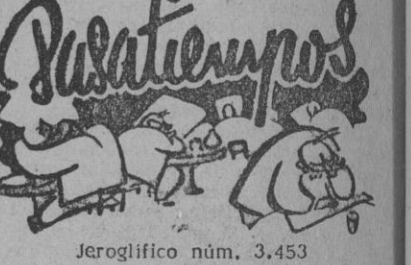
Jeroglífico núm. 3.453 ¿SON YA LAS CINCO Y CUARTO?

TRIESTE, 27. — Un intenso terremoto, cuyo epicentro se encuentra probablemente en la costa italiana, al sur de Nápoles, ha sido registrado en el Instituto Geofísico de Trieste a la una de esta madrugada.