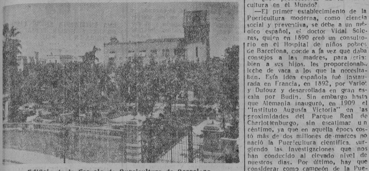
Edificio de la Escuela de Puericultura de Barcelona

La primera finalidad de la Medicina es prevenir, tratar de evitar las enfermedades. O sea, la profilaxis de ellas. Pues bien, de la Pediatría — que es la Medicina aplicada a los niños — nació la Puericultura. Pfleudler, dijo: «Los niños enferman por la alimentación, pero mueren por la infección».