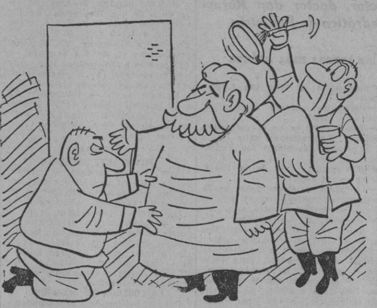
—Podéis decirle a ese corresponsal extranjero que pase.