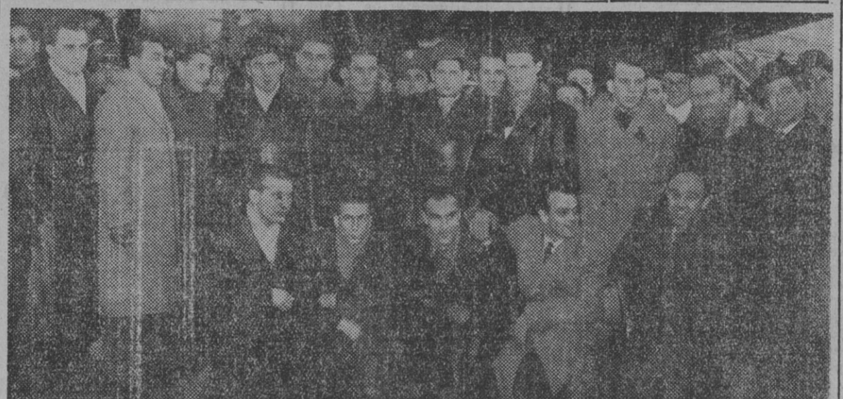
Los componentes del equipo alemán de fútbol que se enfrentarán a la selección de España, fotografiados a los pocos momentos de su llegada al aeropuerto de Barajas. Con ellos aparece el presidente de la Federación Española de Fútbol, señor Sancho Dávila, y otros directivos de dicha Federación que acudieron a recibirlos.