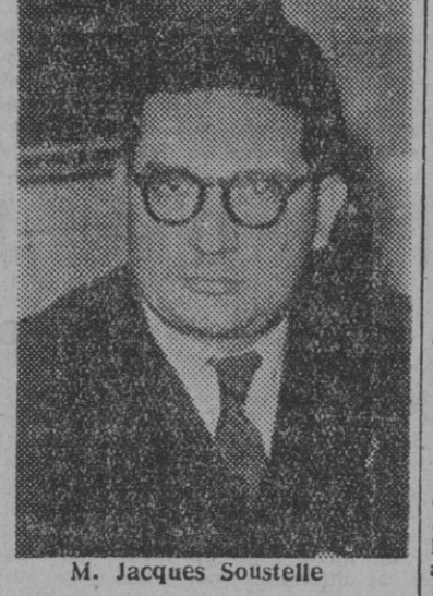
M. Jacques Soustelle

PARIS, 27. — Se espera que Jacques Soustelle, encargado de formar Gobierno, diga hoy al presidente Auriol si está decidido a pedir a la Asamblea Nacional el voto de confianza para proceder luego a tratar de la reforma constitucional. Bajo la actual Constitución, la Asamblea debe aprobar su programa provisional antes que el nombre de sus ministros, y luego, aprobar el nuevo Gabinete en bloque. Soustelle dijo ayer, después de aceptar la tarea de formar Gobierno y de comenzar inmediatamente sus consultas con los diversos jefes políticos, que «bajo la actual Constitución nadie puede gobernar». Añadió que «el poder ejecutivo debería ser reforzado al menos por una estipulación de que una votación de no confianza de la Asamblea en el Gobierno implicase la destitución de éste y nuevas elecciones». Esta tarde conferenciará Soustelle con Pinay, luego de haberse entrevistado esta mañana con los jefes de los distintos grupos parlamentarios. Luego informará a su partido, el R. P. F., de los resultados de sus conversaciones. — Efe.