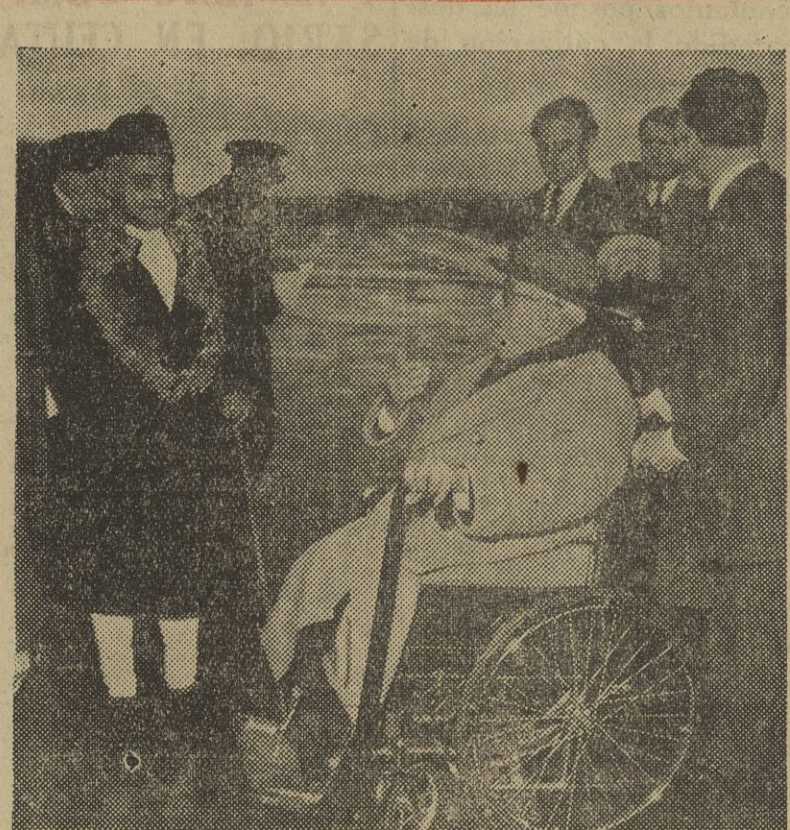
EL AGA KHAN EN EL AEROPUERTO DE NIZA. — En ruta hacia su país, procedente de la Conferencia del Reino Unido, celebrada en Londres, se detuvo en Niza el primer ministro del Pakistán, siendo huésped del Aga Khan durante algunos días. Aquí vemos al Aga Khan, en una silla de ruedas, recibiendo, en el aeropuerto, el saludo del "premier" pakistani, que ostenta la tradicional guirnalda de flores en torno al cuello. Con ellos se hallan los príncipes Ali y Sadri Khan

Un comerciante de Donauschingen (Alemania), después de un viaje por Italia, ha solicitado el divorcio. —Disponible de 4 días de vacaciones — declaró el comerciante ante el juez —, dos de los cuales los pasamos en el viaje y los otros dos en un hotel, ya que mi mujer se ocupó exclusivamente todo el tiempo en escribir tarjetas postales desde la tierra del sol. El divorcio ha sido concedido.