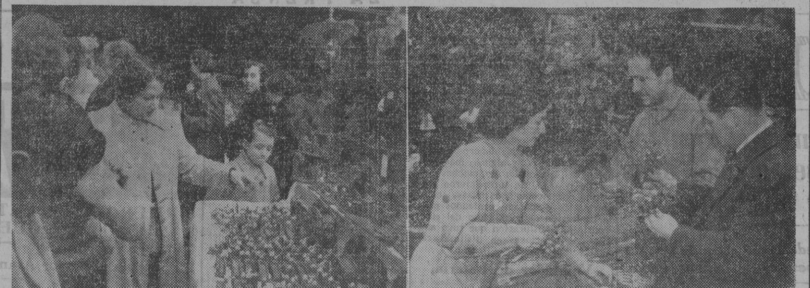
Como en años anteriores, la plaza de la Catedral se ha poblado de los típicos puestos expendedoros de motivos belenísticos. Los barceloneses acuden a esta simpática feria para adquirir las figuras, y adonos que han de formar el belén hogareño, que tanto emociona a pequeños y mayores.