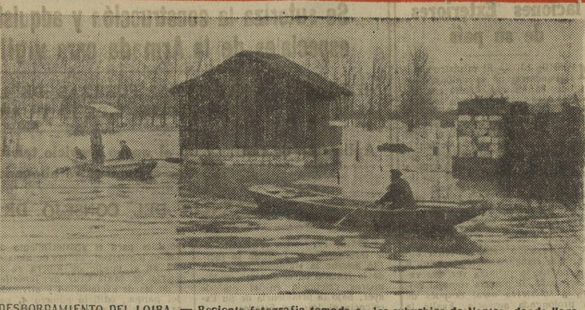
DESBORDAMIENTO DEL LOIRA. — Reciente fotografía tomada en los suburbios de Nantes, donde llegaron las aguas del Loira. El único medio de comunicación constituían lanchas y almadrabas.

Los diez avances más importantes de la ciencia y de la técnica en 1952