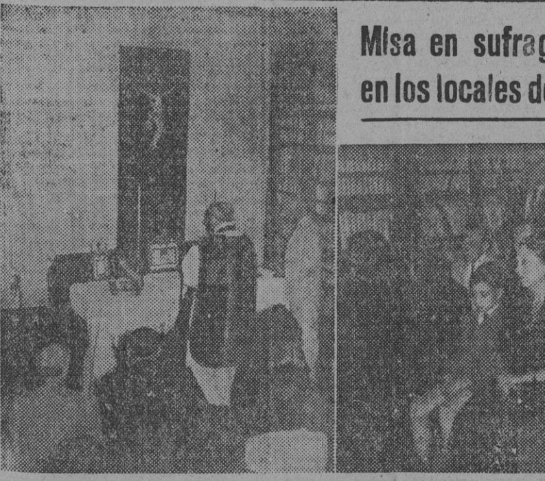
Por especial concesión del prelado de nuestra diócesis se ha celebrado en sufragio del alma del redactor de "El Correo Catalán", don Ricardo Suñé, fallecido en accidente, una misa en los propios locales del periódico al que dedicó todos los afanes de su vida periodística. Al piadoso acto han asistido numerosos compañeros del finado y familiares del gran periodista barcelonés. — (Fotos Pérez de Rozas.)

Misa en sufragio de Ricardo Suñé en los locales de "El Correo Catalán" Por especial concesión del prelado de nuestra diócesis se ha celebrado en sufragio del alma del redactor de "El Correo Catalán", don Ricardo Suñé, fallecido en accidente, una misa en los propios locales del periódico al que dedicó todos los afanes de su vida periodística. Al piadoso acto han asistido numerosos compañeros del finado y familiares del gran periodista barcelonés. — (Fotos Pérez de Rozas.)