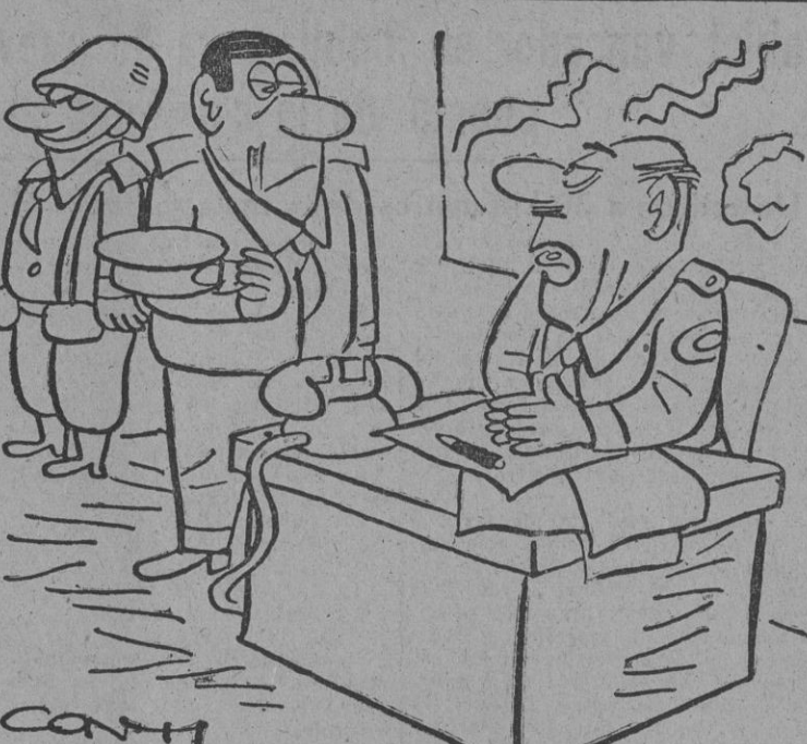
—Necesitamos nuevos delegados para Panmunjon y como nos hemos enterado de que usted en la vida civil era árbitro de fútbol...

La mayoría del Consejo de Seguridad lo estima así, ya que el estancamiento sobre la cuestión es indestructible